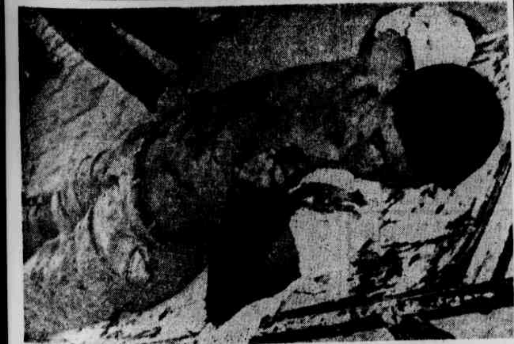
O corpo do bicheiro assassinado

Não se trata, é evidente, do Estado tornar-se patrão, mas incentivador da iniciativa privada, através da sua ação em busca de novas fontes de riqueza e disciplinando o processo em favor de todos. (Artigo de Tenório, na terceira página.)