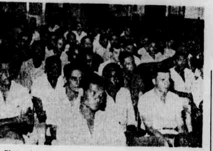
Flagrantes da assembléia dos bombeiros hidráulicos

ELETRICISTAS E BOMBEIROS HIDRÁULICOS QUEREM QUARENTA E CINCO POR CENTO SOBRE O SALÁRIO-MÍNIMO PARA OS MEIO-OFICIAIS E SESENTA E SEIS POR CENTO PARA OS OFICIAIS