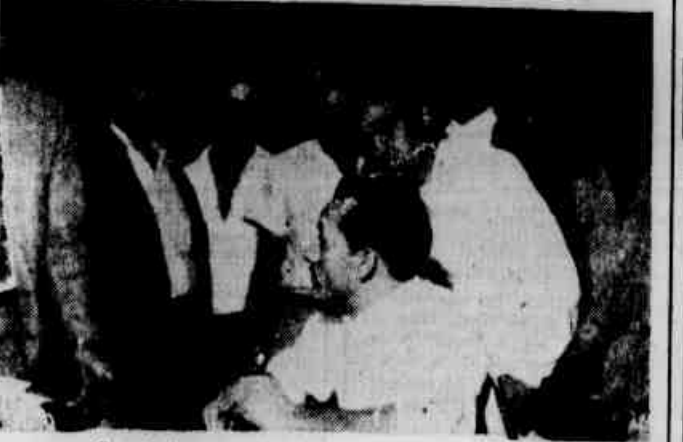
Operários navais em nossa redação

APOIO AO MOVIMENTO PELA REVISÃO DO SALÁRIO-MÍNIMO (TEXTO NA PÁGINA DOIS.)