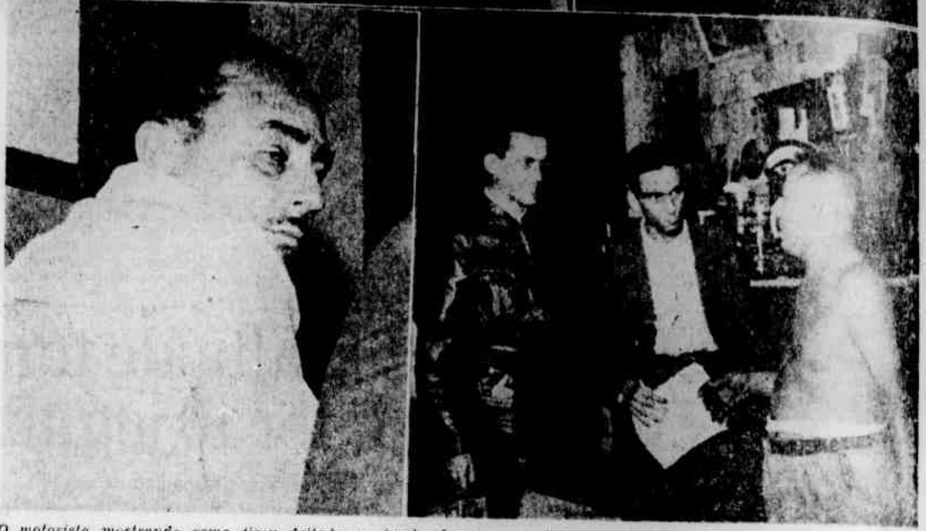
O motorista mostrando como ficou deitado no fundo do carro; ao lado, quando falava a reportagem; embalo, o outro motorista assaltado e o dono do bar da Rua Clorimundo de Melo prestando esclarecimentos