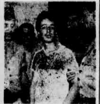
Um dos menores delinquentes

Na sessão matutina de ontem, da Câmara dos Deputados, foi aprovado, na Ordem do Dia, por 129 contra 54 votos, o parecer que opina pelo arquivamento da representação em que o sr. Aurélio Viana solicita a instauração de processo de perda de mandato do sr. Paulo de Tarso. Desse modo, o ex-prefeito do Distrito Federal reassumirá sua cadeira na Câmara dos Deputados, pelo Partido Democrata Cristão, de São Paulo.