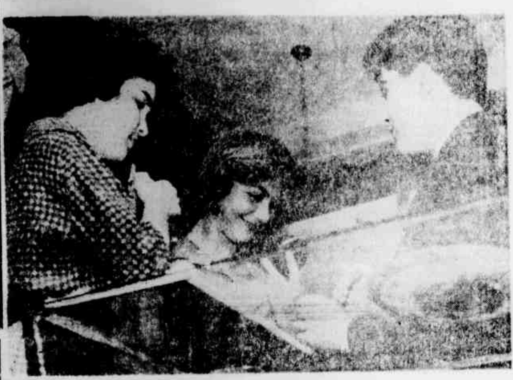
O suicida no lado de duas jovens da sociedade

Um jornal de luta feito por homens que lutam pelos que não podem lutar Diretor-Responsável: TENÓRIO CAVALCANTI | Redator-Chefe: SANTA CRUZ LIMA ANO VIII — Rio de Janeiro, 6 de outubro de 1961 — Nº 1254