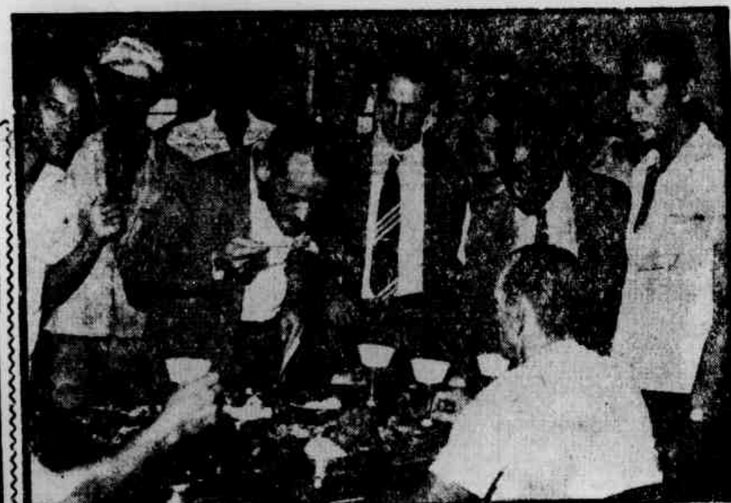
O repórter prova a comida, junto com o presidente do sindicato