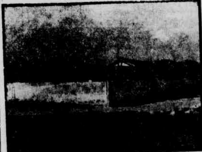
A casa de tolerância que funciona em Magé, organizando uma rede de escravatura branca

Além do jogo roubado em Mauá, o tráfico de mulheres — Delegado participa das bacanais na "Boite Azul" — (Texto na página 5)