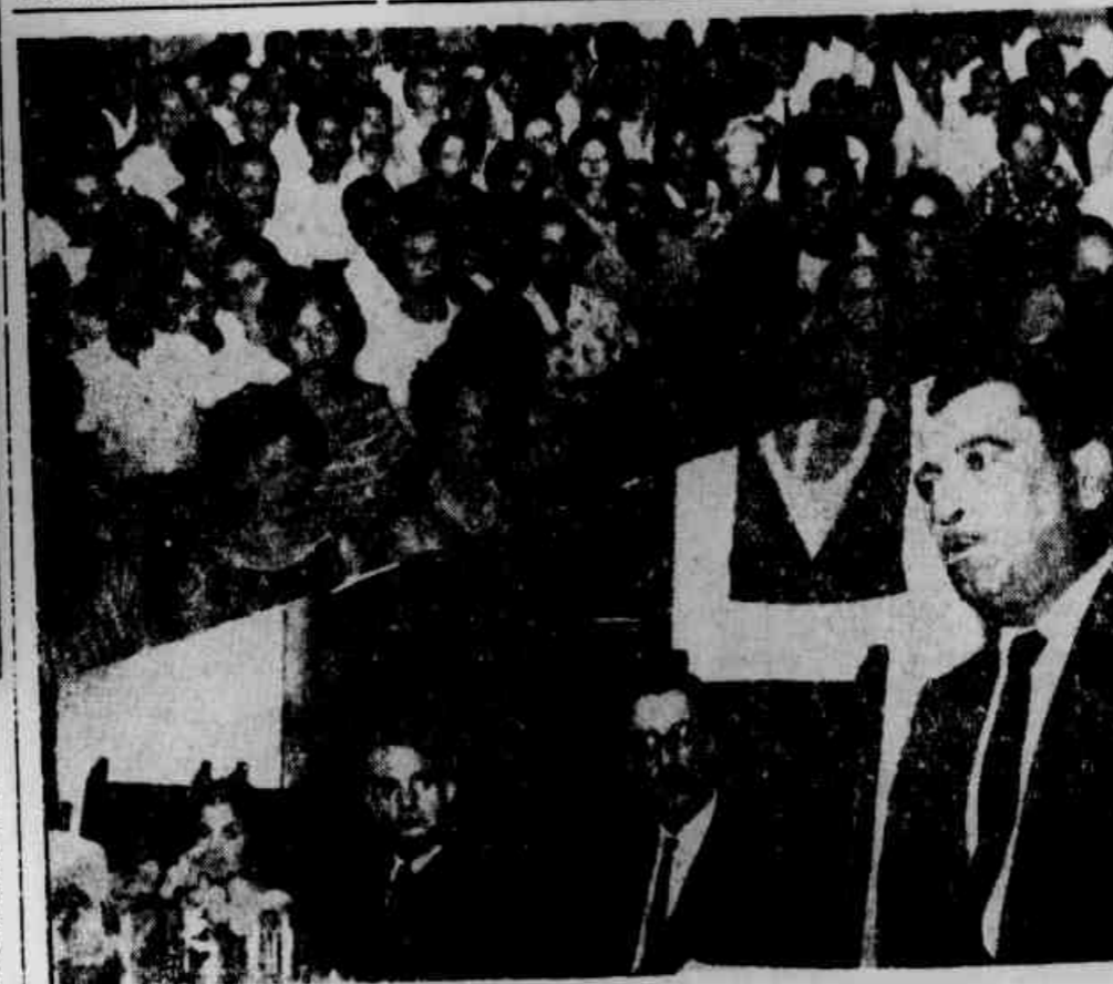
Flagrantes da assembleia dos servidores do SAPS