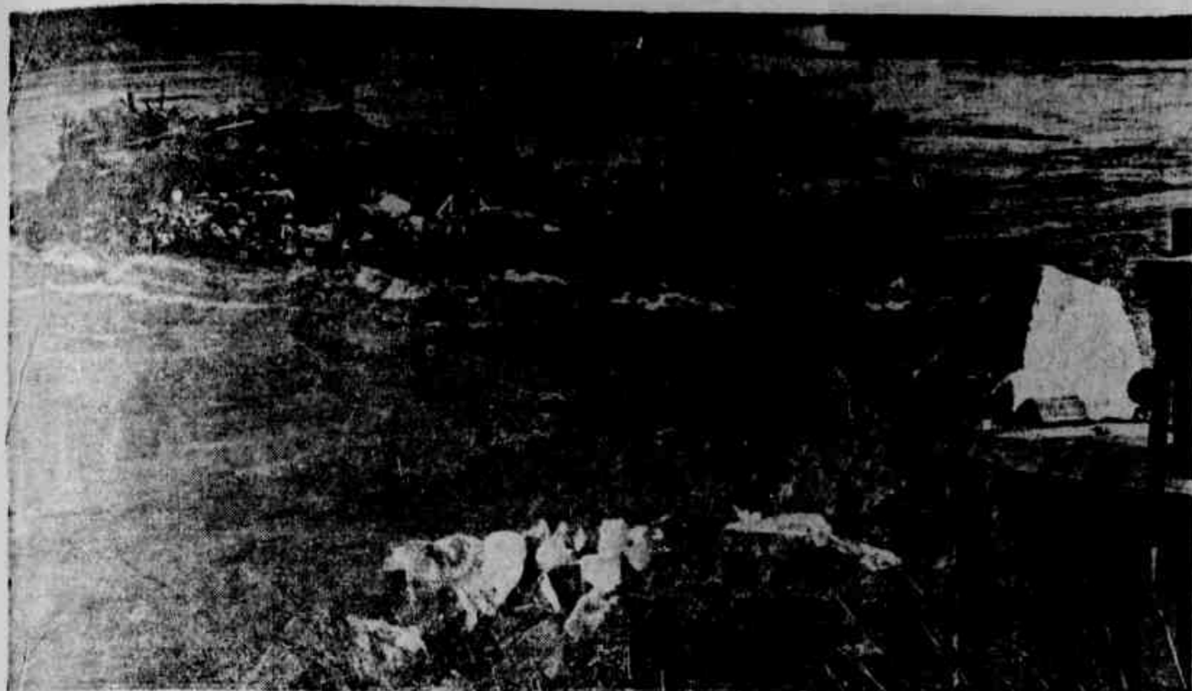
Local onde estão aparecendo os cadáveres

(LER NA PÁGINA FLUMINENSE, EM SINDICALISMO NO ESTADO DO RIO)