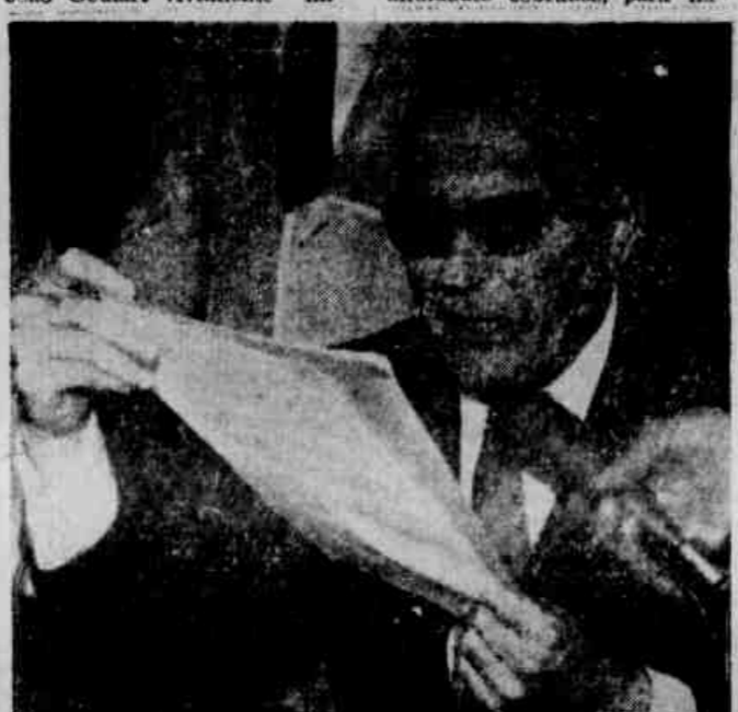
O ministro Júlio Sambaqui, quando fazia a comunicação à imprensa

O ministro Júlio Sambaqui, logo após regressar de Petrópolis, onde despachou com o presidente João Goulart, decidiu convocar a imprensa para uma comunicação de importância para todos os estudantes brasileiros de nível médio. O titular da Educação e Cultura era para os jornalistas, na ocasião, o seguinte comunicado: "O presidente da República determinou, em Petrópolis, ao ministro da Educação, energias providências para coibir a alta abusiva das taxas escolares."