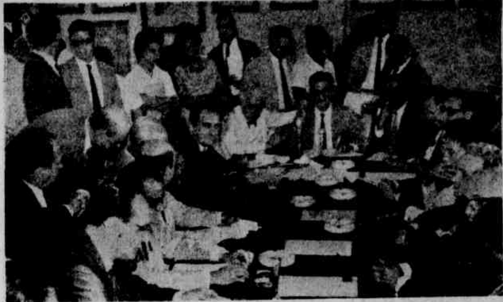
Flagrante da movimentada assembleia de ontem na FCF e seu presidente