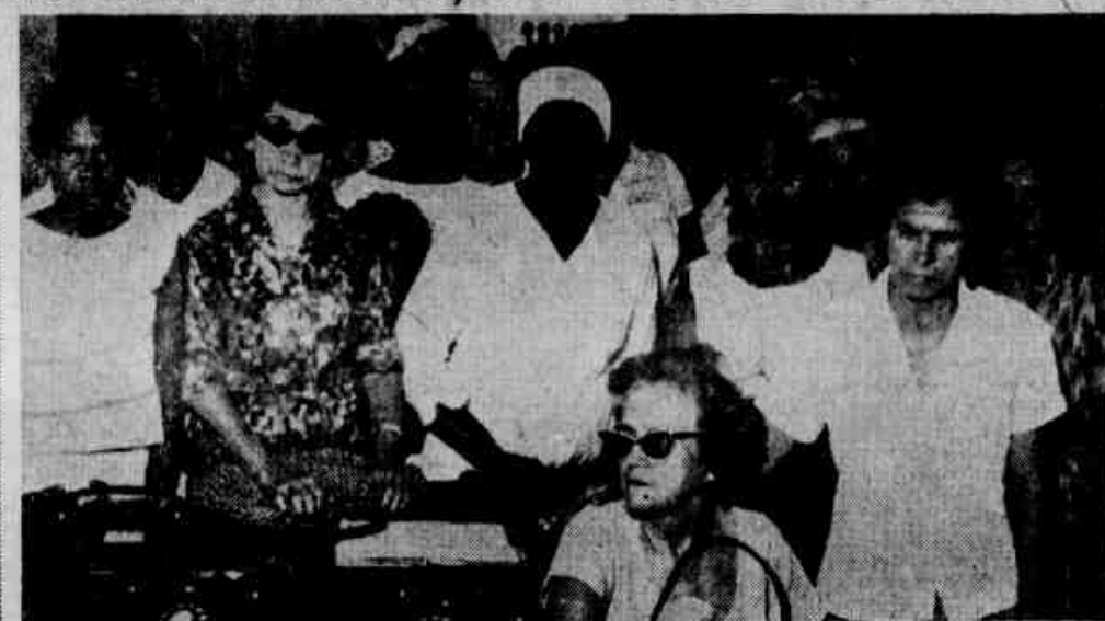
A comissão de viúvas de ferroviários em nossa redação

UM GRUPO de pensionistas, representando quase mil viúvas de ferroviários, procurou, ontem, o diretor da Rede Ferroviária Federal, na administração da Central do Brasil. Como era natural, não se encontrou (Conclui na 2.ª pág.)