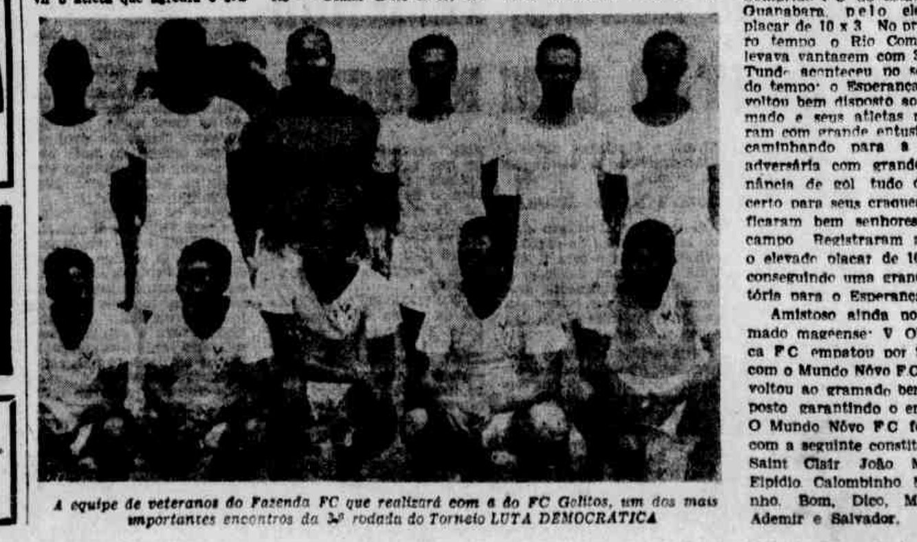
A equipe de veteranos da Fazenda FC que realizará com a do FC Galitos, um dos mais importantes encontros da 3ª rodada do Torneio LUTA DEMOCRÁTICA