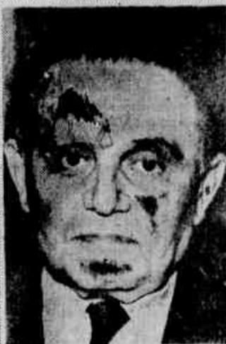
Presidente-marechal Castello Branco