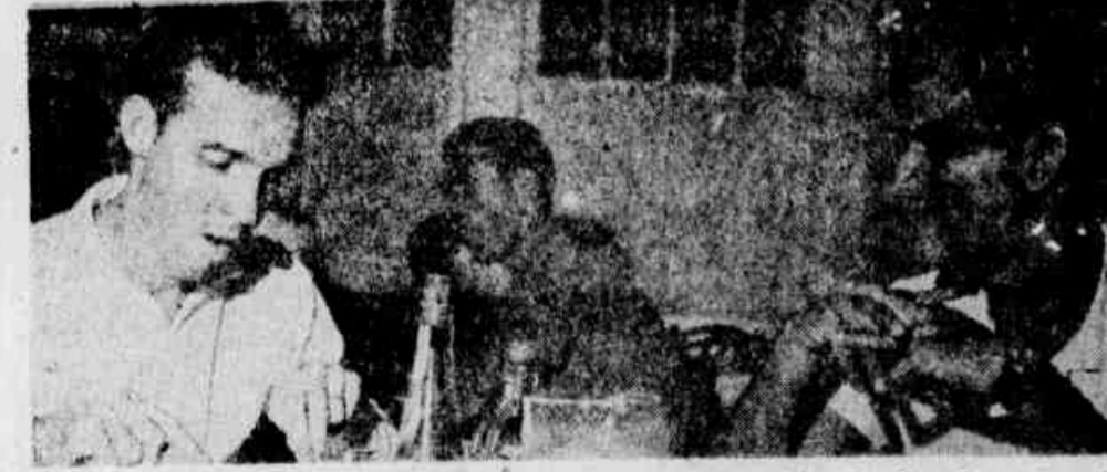
Com mais adversários em casa que nos próximos times contrários, Zagalo sabe que precisará de todas as forças para ter nova "chance" de entrar no time, e, contra os portugueses, confirmar o que fez em 58 e 62