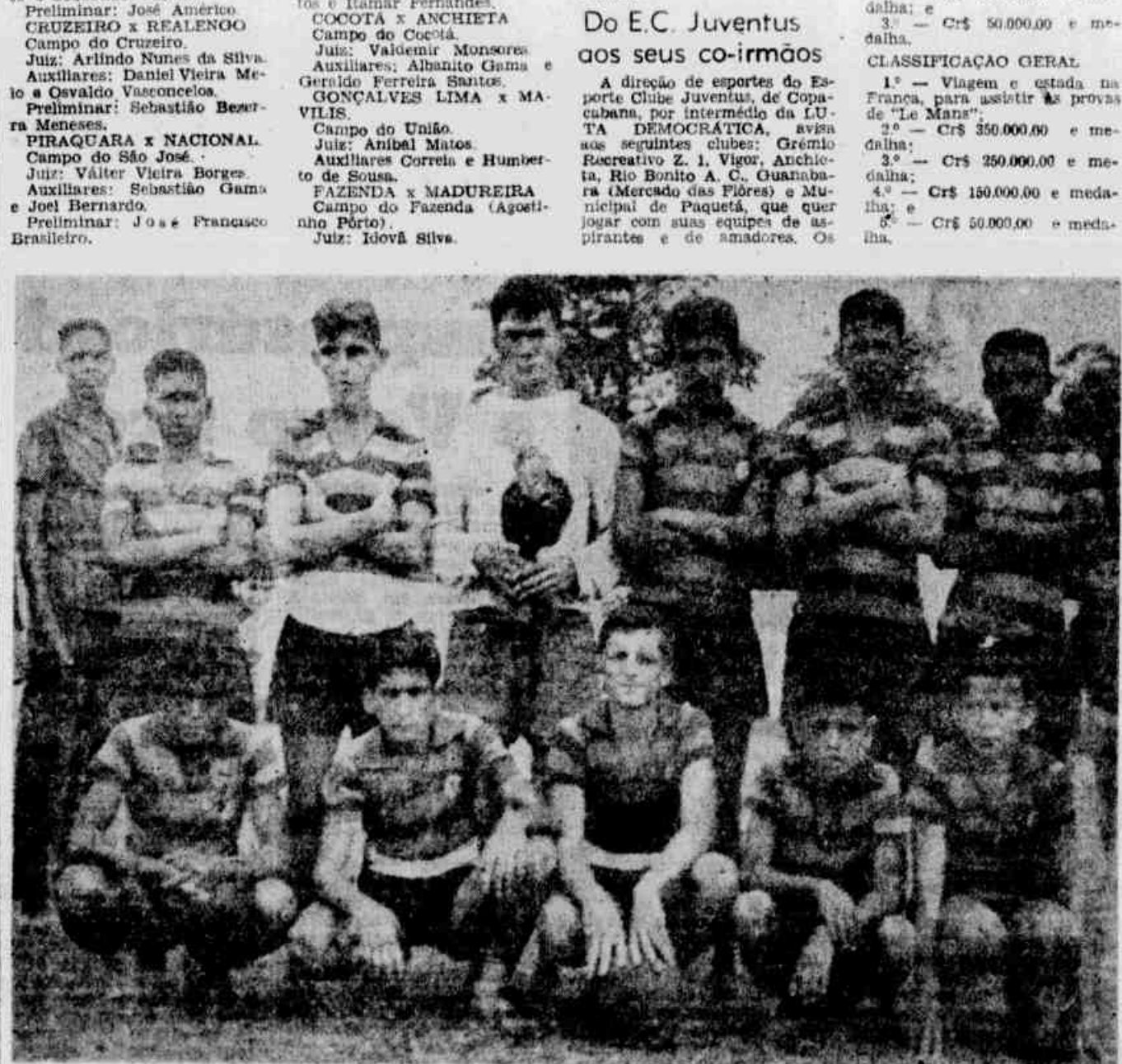
At estão os garotos do Flamenquinho, que enfrentaram domingo, o quadro invicto do Novo Brasil. A meninada da fibra do rubronegro de Olinda, não conseguiu quebrar a invencibilidade dos jovens caxienses, mas, também, não se deixaram vencer. Já é alguma coisa.