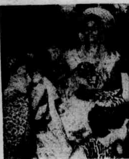
* Lindos brotinhos como estes da foto, pulando com alegria contagiante, é a tônica principal dos bailes no Siri e Libanês que este ano promete ser melhor

Será do treinador Renganeschi a última palavra com referência à proposta da América que quer comprar e Fio. Pode-se afirmar, todavia, que o treinador rubro-negro dificilmente concordará com a troca.