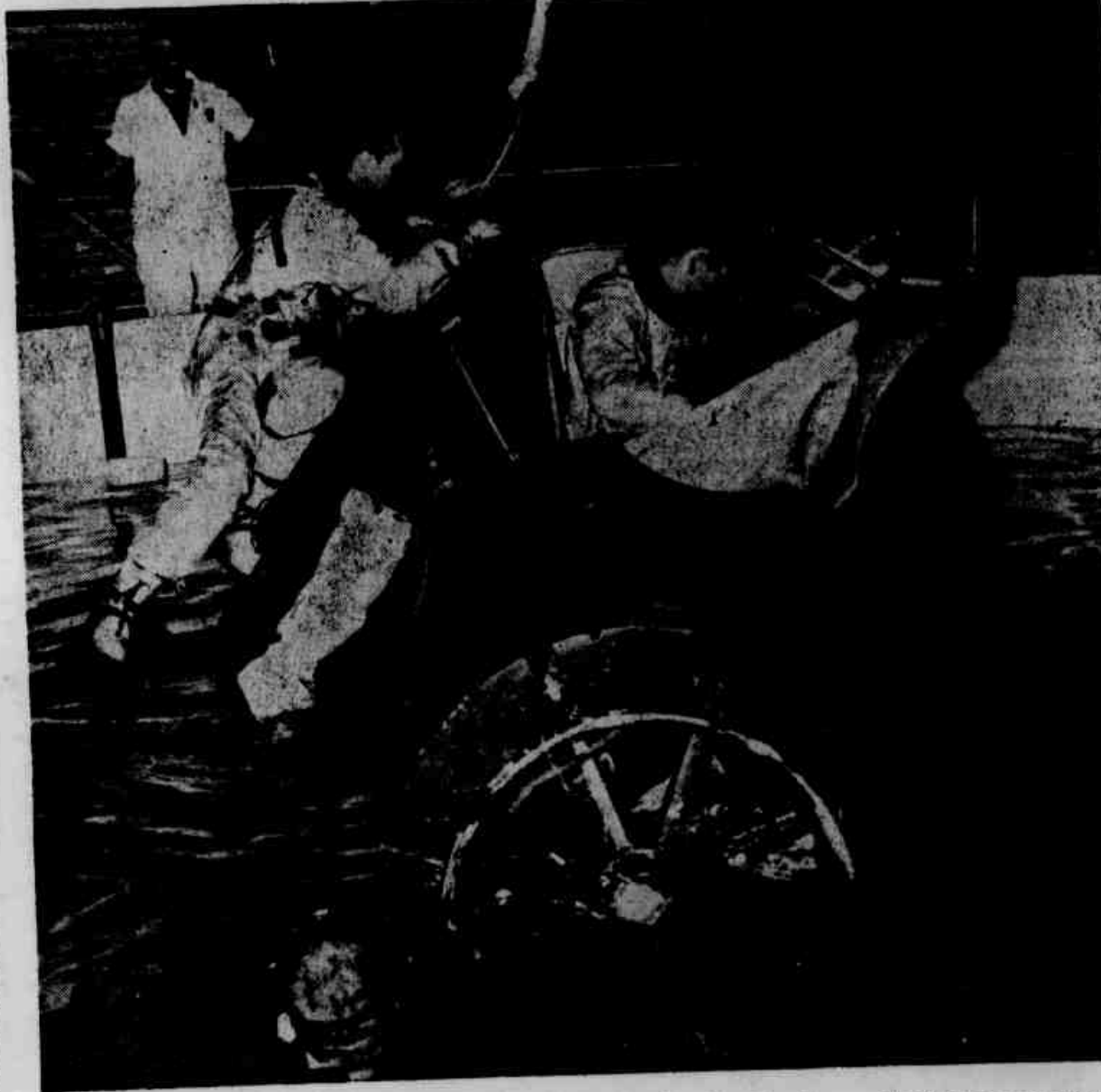
* O treinamento dos astronautas é intenso, árduo e arriscado, além do envelhecimento prematuro a que estão sujeitos.

Para hibernar um homem — frou o médico da PAB — ter-se-ia que reduzir radicalmente sua temperatura corporal e, assim, baixar seu metabolismo ao mínimo. A circulação e a respiração e as demais funções orgânicas deveriam ser mantidas ao nível dos hibernantes. Conquanto pessoas tenham sido recordadas após temperatura retal de 18°C e até baixo, recorda-se que temperaturas inferiores a 24°C são igualmente letais. Abaixo de 30°C a morte sobrevém por fibrilação ventricular e, esta cifra marca o limite de anestesia hipotérmica, reduzindo a taxa metabólica de 50% normal, e a 20% da temperatura de 25°C. Daí, o envelhecimento se processaria então, na metade da taxa normal e, a meio hibernação de um ser negro, com redução de apenas 7°C por longo período, seria uma condição mais fácil de ser reduzida no homem.