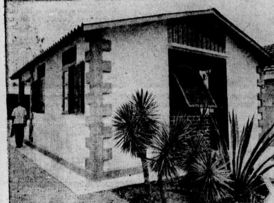
A primeira Casa Pacote construída está em exposição para visitas à Rua Prof. Arthur Thirv, 105