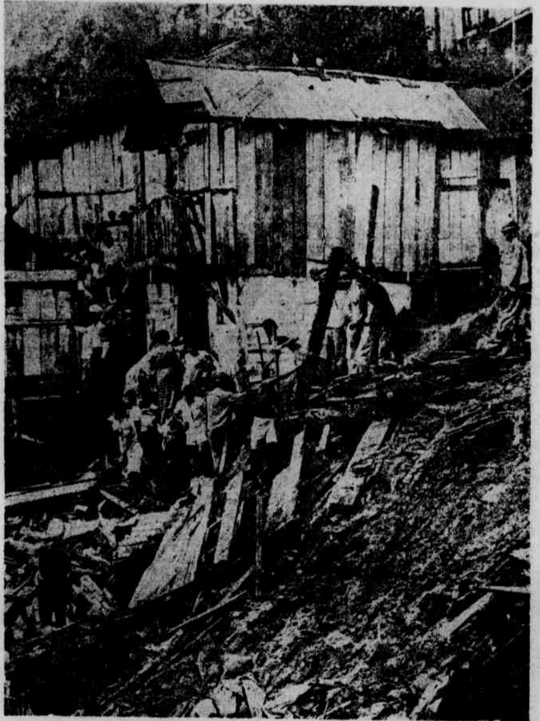
* Aspecto do desabamento ontem ocorrido no Morro de Santa Marta, vendo-se ainda moradores dos barracos destruídos retirando seus pertences do meio dos escombros