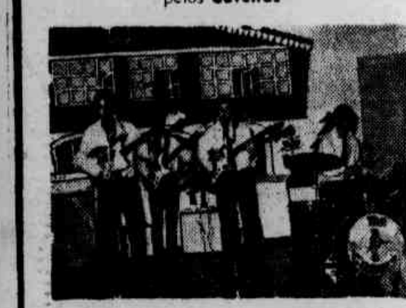
* "The Crows" representa o Pôsto Seis de Copacabana