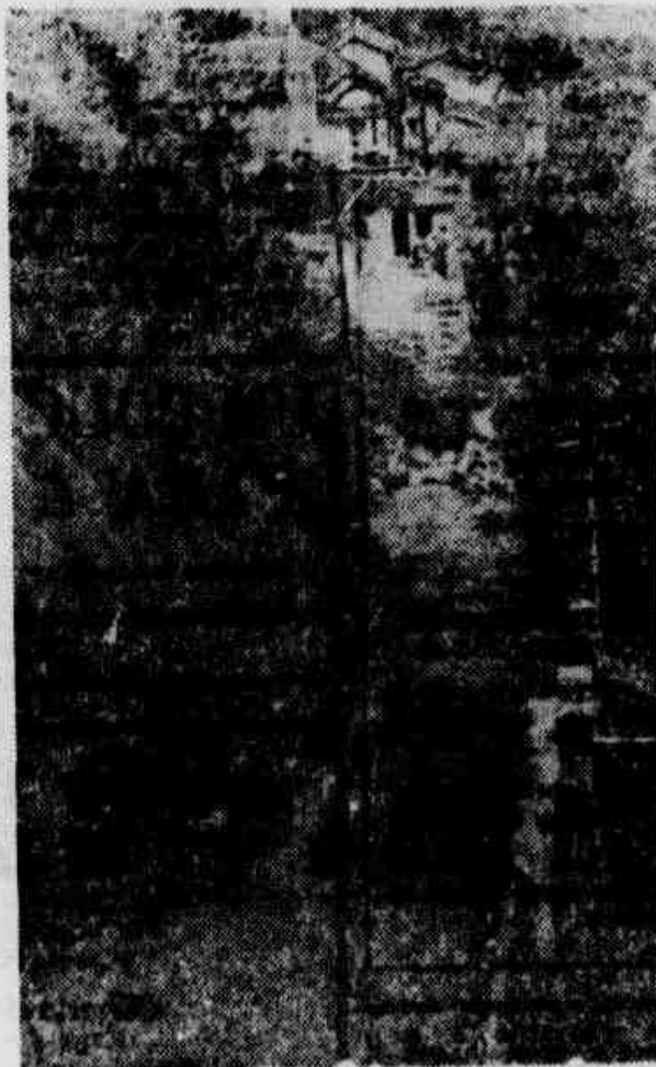
* Um aspecto da Rua Florinda, parcialmente pavimentada. O resto é mato, lixo e lama