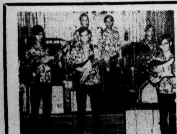
* Todos os Santos será representado pelos Caveiros