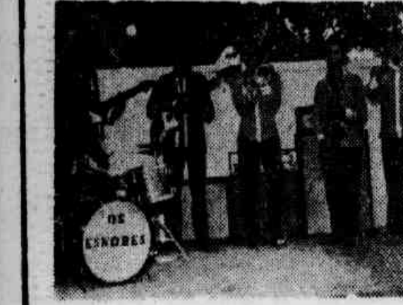
* Os Esnobes, levarão de Voz Lóbo, sua torcida organizada, e estão preparados para chegar às finais