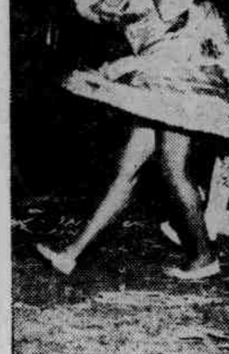
O Frevo do Vassourinhas abrilhantou enormemente o Carnaval Bonzão do Méier

do os sambas enredos das escolas de samba e dos blocos carnavalescos em sessão especial, prevista na imagem do carnaval de 68.