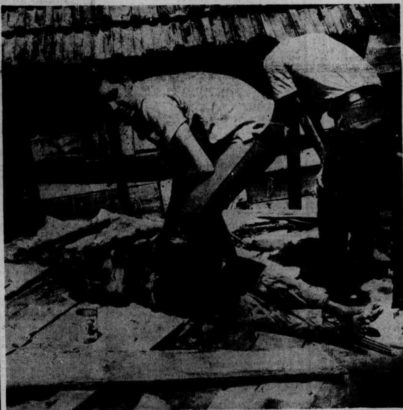
Presunto frio em teto de zinco quente...

Mais de 13 mil menores foram vitimados — Cerca de 1.800 ficaram internadas — (Leia texto na segunda página)