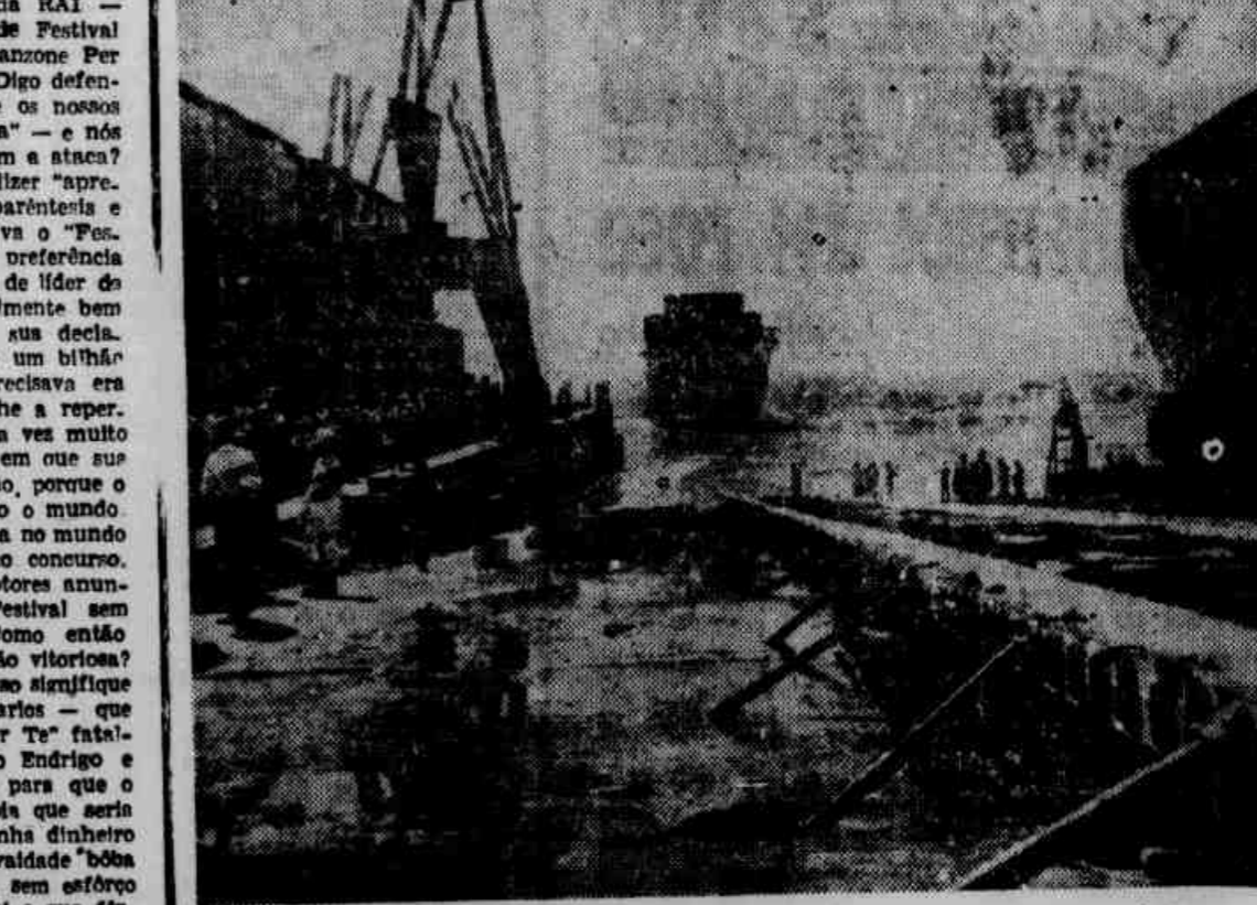
O Alberto Cocozza, quando deixava os Estaleiros Mauá para sua missão de navio-frigorífico