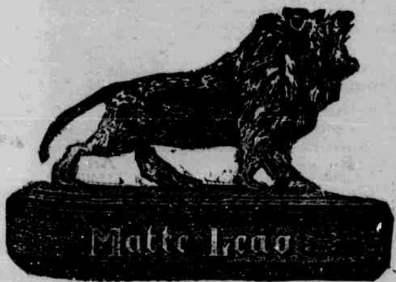
(o chá brasileiro)

venda nos estabelecimento de primeira ordem