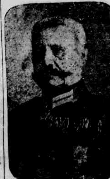
fora uma grandiosa reafirmação em favor do actual Chefe do Estado. Nos ultimos dias antes da eleição a luta politica atingiu uma extraordinaria acerbidade. Na noite do escrutinio mais de 16 milhões de alemães (ha na Alemanha 4 milhões de receptores radiofónicos) escutaram ansiosos os resultados: que os postos emissores iam transmitindo á medida que se ia fazendo a contagem. A votação de Hindenburg oscilava em torno da maioria absoluta, ficando no resultado final uns 160.000 votos abaixo desta, de modo que pela lei se torna necessario proceder a um segundo acto eleitoral cujo resultado, porem, não é preciso ser profeta para se dizer que será uma confirmação aumentada do primeiro. O proprio dia da eleição, em contraposição á apalxonada agitação antecedente, decorreu na maior das disciplinas: na capital não houve recontros serios nem excessos graves, para o que contribuíram não em ultimo lugar tambem as providencias tomadas pela policia. Nesse dia não houve nas ruas: caminhões cobertos de bandeiras e cartazes, carregados de incansavel gente moça saltando continuamente altos brados em favor dos candidatos nem cortejos desfilarão ao som de clangorosas fillarmónicas, não se realizaram comícios em massa (na semana precedente só em Berlim tinha havido cinco mil), no ar não cruzavam sussurrantes aviões: lançam a propaganda que tinha gasto uns 80 vagões de papel, e aos olhos dos cidadãos que acorriam aos numerosos locais onde estavam instaladas as urnas, deparavam-se mais uma vez, afixados nas colunas de anuncios, os cartazes, alguns de elles muito suggestivos, representando os diferentes candidatos. — Hitler ou Hindenburg... era o dilema. A campanha eleitoral tinha agitado como nunca até á todas as camadas da população, milhões e milhões achavam-se dominados pelo enorme incremento do movimento nacional-socialista, milhões e milhões escutaram emocionados o discurso radiodifundido de Hindenburg, em que o venerando Marechal, com a grande dignidade intrinseca e sentimento de dever que o distinguem, se declarou disposto a apresentar de novo a sua candidatura. — O resultado da eleição foi um grande exito moral para o Chefe do Estado, a cujo brilho historico e gloria um povo grato e circunspecto testemunhara assim o seu reconhecimento. A Alemanha pode proseguir em sossego na luta contra a miseria economica e continuar a trabalhar na solução dos seus problemas politicos.

A grande transformação que nos ultimos anos effectuou na opinião publica universal sobre a Alemanha, manifesta-se claramente no grande numero de festas que se celebram no mundo inteiro em comemoração do primeiro centenario da morte de Goethe. O espirito do maior dos poetas alemães passa por todas as partes da terra. Em toda a Alemanha, no dia 22 de março á hora da sua morte todos os sinais dobraram a finados, e no seu túmulo no mausoleu dos Duques de Weimar foi depositada uma coroa em nome do povo alemão, Berlim, Weimar e Frankfurt, a par de muitas outras cidades do Reich, rivalizam na honra de, com representações de gala, exposições e conferencias, tornar o "ano de Goethe" especialmente festivo. "Goethe e o seu Mundo" intitula-se uma exposição recentemente inaugurada nos lindos salões da Academia Prussiana de Belas-Artes na "Pariser Platz", exposição em que se exhibem as descrições graficas, contemporaneas, do poet., em manuscritos, livros e medalhas, sobre a vida e obra de Goethe, e numa sala separada abrange tudo o que a Goethe em Weimar e á sua mor-