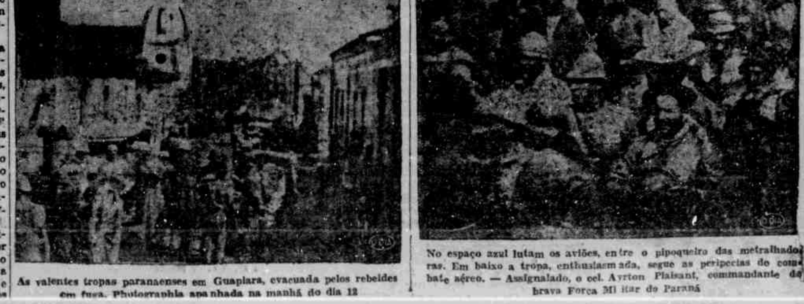
As valentes tropas paranaenses em Guapirã, evacuada pelos rebeldes em fuga. Photographia apanhada na manhã do dia 12