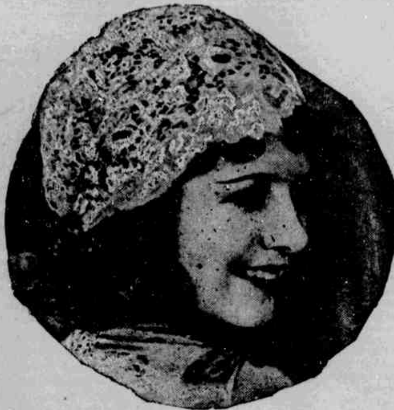
Janet Gaynor O film maximo deste anno A maior das grandes produções da FOX MOVIE TONE

com RAUL ROULLIEN DELICIOSA — poema de um sentimento bonito, atravez de um amontoado de circunstancias adversas e movimentadas... E' a synthese dos mais cotados valores do celluloido americano "Delicious", a super-produção da FOX MOVIE TONE, é o baptismo da carreira cinematographica de ROULLIEN, o "muchacho de oro" do Brasil agora glorificado pela FOX