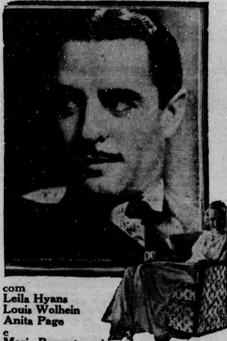
com Leila Hyans Louis Wolhein Anita Page e Marie Prevost

HOJE -- Sessão Corrida ás 7,30 - HOJE Para satisfazer, plenamente ao desejo de todos os fans curitybancs, mais uma vez hoje será exhibido o film que é o mais gigantesco trabalho de interpretação de JOHN GILBERT