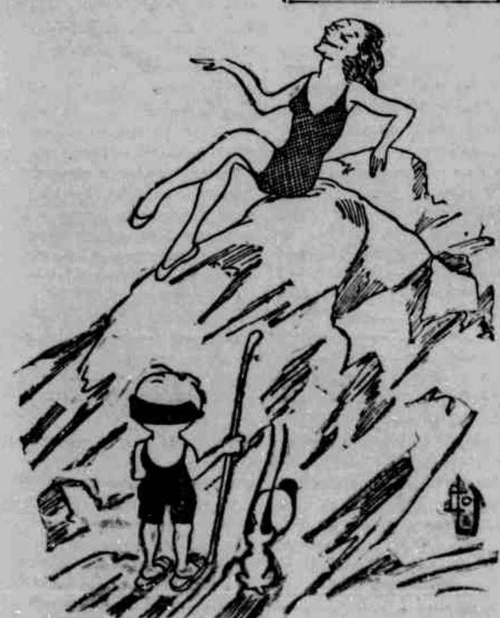
FUMAÇA — Que faz ahí? MELINDROSA — Estou procurando um metodo para estabelecer as ondas do mar...

Tem razão o presidente da Associação Commercial. Nenhuma das forças em jogo vale o sacrificio do Brasil. Este é que deve e que ha de ser salvo.