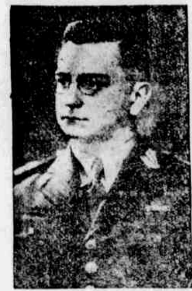
General Francisco José Pinto