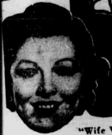
"Wife Vs. Secretary"

CLARK GABLE. Jamais interpretou um papel de tanta complexidade. Entre uma esposa adorada e virtuosa e entre uma linda e virtuosa, mas linda, está provocante, mas fascinante, encarnando, mais fascinante, mais virtuosa. — Além disso, uma tremenda intriga.