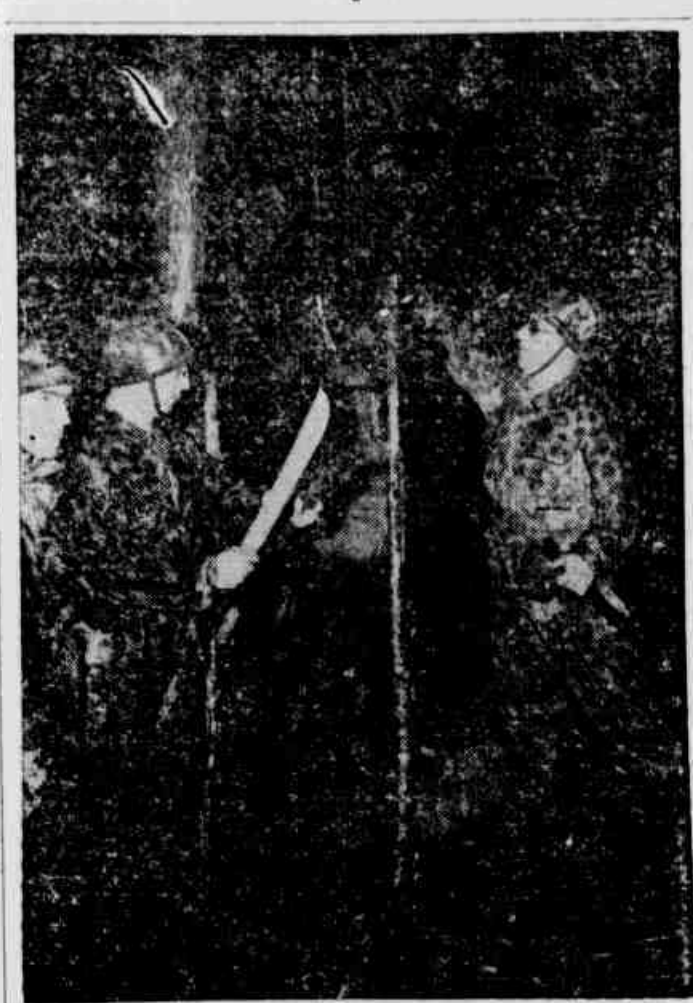
OFICIAIS COLOMBIANOS — Três oficiais do exército da Colombia que atualmente realizam um curso de aperfeiçoamento em uma escola norte-americana da zona do Canal do Panamá, envergando uniformes camuflados constroem um abrigo em plena selva, como parte do aprendizado da tática de luta nas "jungles".