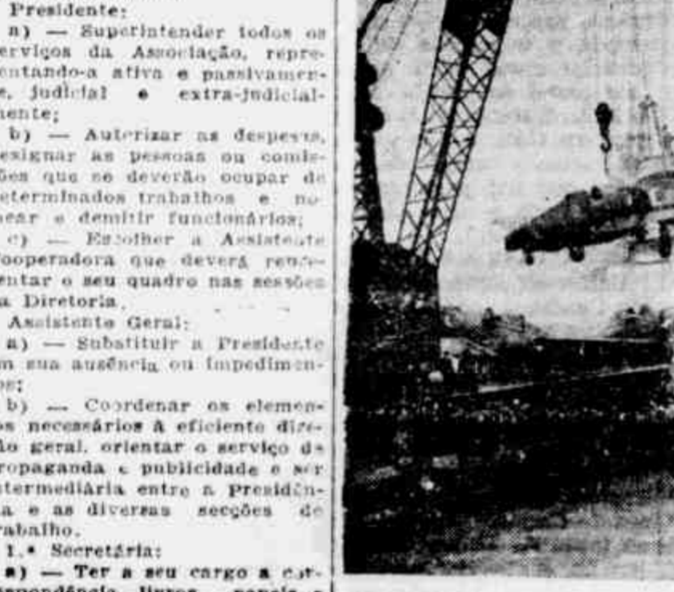
destinadas à invasão do continente europeu. Tudo indica que se aproxima rapidamente a libertação do Velho Mundo das garras de Hitler...

OS PONTOS PREFERIDOS PELAS PESSOAS DE BOM GOSTO: CAFÉ PATRIA