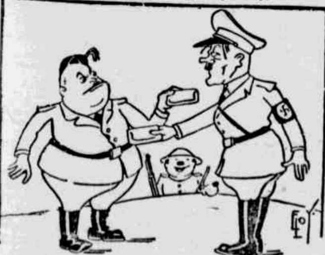
Você não acha que o aniversário da aliança deve ser assinalado por telegrama, ex-Duce? É, fica bem. Por um fio!...

"LONDRES — Hitler e Mussolini trocaram amáveis telegramas para assinalar o quinto aniversário da aliança nazi-fascista". — (Dos jornais).