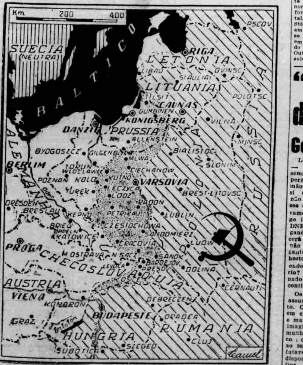
No decorrer de apenas uma semana da atual ofensiva de inverno, os russos conquistaram breves faixas de terreno na Polónia, invadiram a Silesia e se aprofundaram nos territórios da Prussia Oriental e na Checoslovaquia. Partindo de Sandomierz, os corpos do exercito do marechal Stalin levaram de vencida as tropas germanicas, derrotando-as de maneira franca e quase total. Nessa arrancada fulminante, os russos libertaram Varsavia, Cracovia e Lodz, e quase todas as numerosas outras cidades polonesas. Os objetivos dos russos são: Danzig, Königsberg, Breslau e finalmente Berlim.

Afundado um transporte norte-americano WASHINGTON, 25 (United Press) — Foi afundado, devido a ação do inimigo, um transporte conduzindo 2.200 soldados norte-americanos. Segundo a informação prestada nesta capital, pelo secretario da Guerra, Stinson, o ataque verificouse em aguas da Europa, salvaram-se mil e quatrocentos soldados em numerosos rebaldos, pescaram duzentos e quarenta e oito. Outros quinhentos e dezesseis soldados estão desaparecidos.