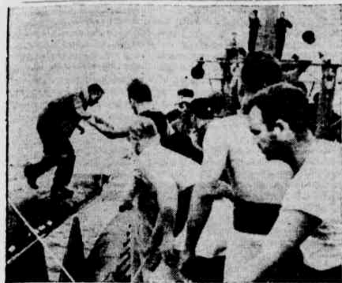
SALVOS EM ALTO MAR — Vê-se na fotografia aviadores norte-americanos de um avião, que caiu no mar, sendo salvos por um submarino.