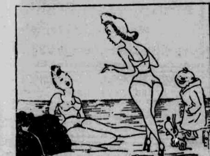
— Porque não usas um calção menor, nadarias melhor? — Não posso, tenho uma cicatriz de apendicite!...