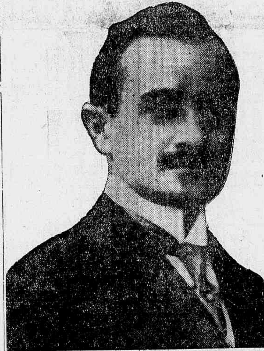
Presidente JOÃO PESSÔA