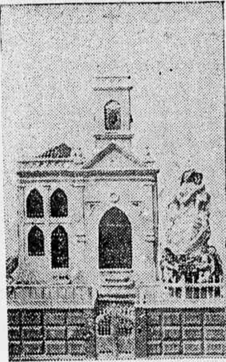
Nossa Senhora do Monte Serrat, que se venera no Morro do Pinto

Realizar-se-ão hoje, os festejos em gloria de N. S. da Conceição organizados pela Irmandade de N. S. do Monte Serrat.