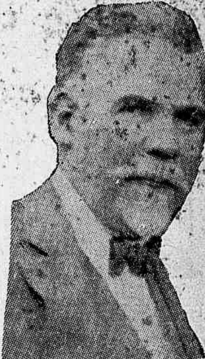
O presidente da Republica fomentador da rebellião do cangaço e que impede que o governo parahybano se defenda

Palavras do presidente João Pessoa sobre a situação politica Parahyba em face dos últimos acontecimentos