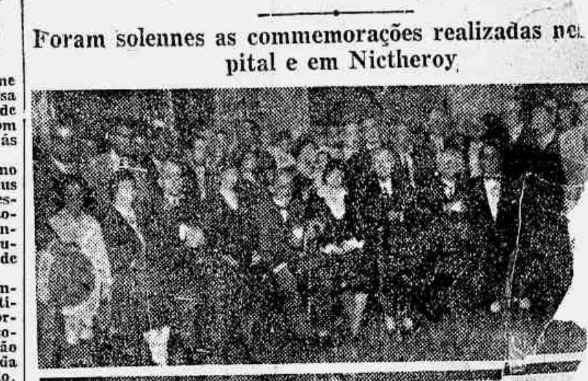
Grupo de pessoas que assistiram, á missa hontem na igreja de Francisco de Paula

Foram solennes as comemorações realizadas no hospital e em Nitheroy