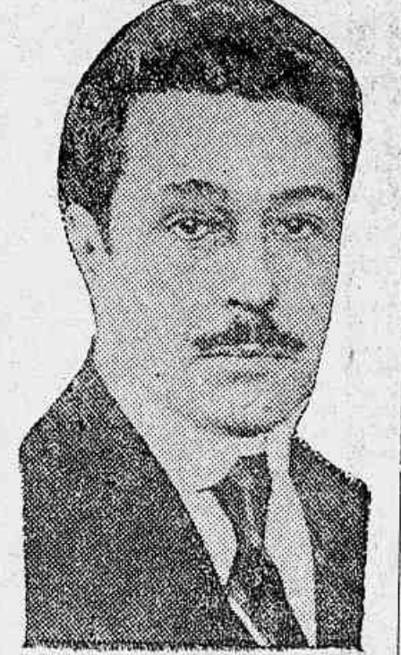
O sr. ministro da Justiça que chamou o juiz substituto a esta capital para se reunir a Junta

Não se reuniu a Junta Apuradora da Parahyba