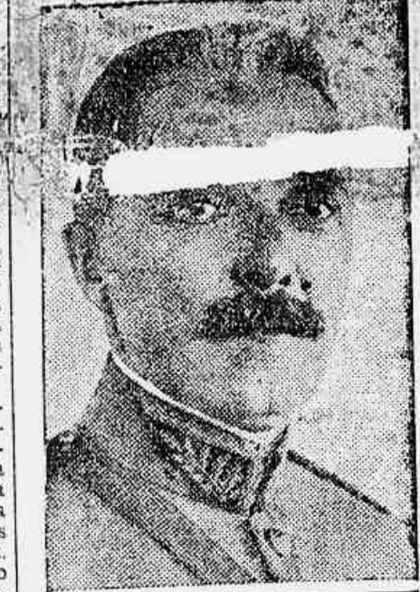
O ministro da Guerra que manda ordens ao commandante do 22º B. C. aquartela na Parahyba

As noticias que chegam aqui de victorias dos cangaceiros são inteiramente falsas. Apenas uma pequena força de 50 praças em expedição no povoado de Patos, foi envolvida por