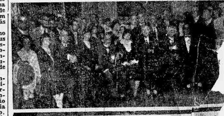
Grupo de pessoas que assistiram á missa hontem na igreja de Francisco de Paula

Foram solennes as commemorações realizadas no palat e em Nicheroy