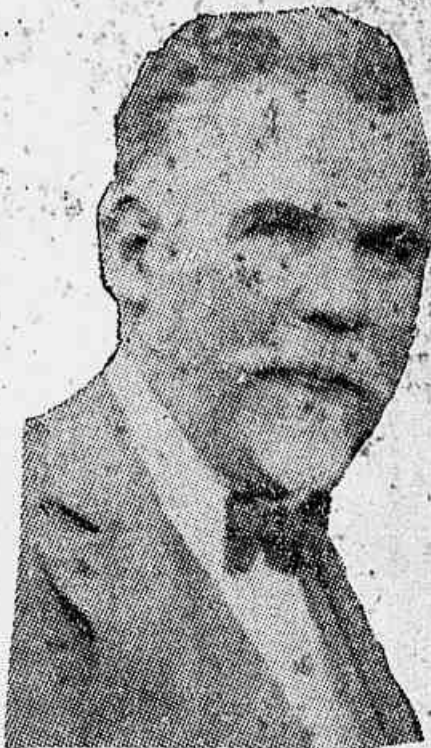
O presidente da Republica fomentador da rebelião do cangaço e que impede que o governo parahybano se defenda

Palavras do presidente João Pessoa sobre a situação politica Parahyba em face dos ultimos acontecimentos