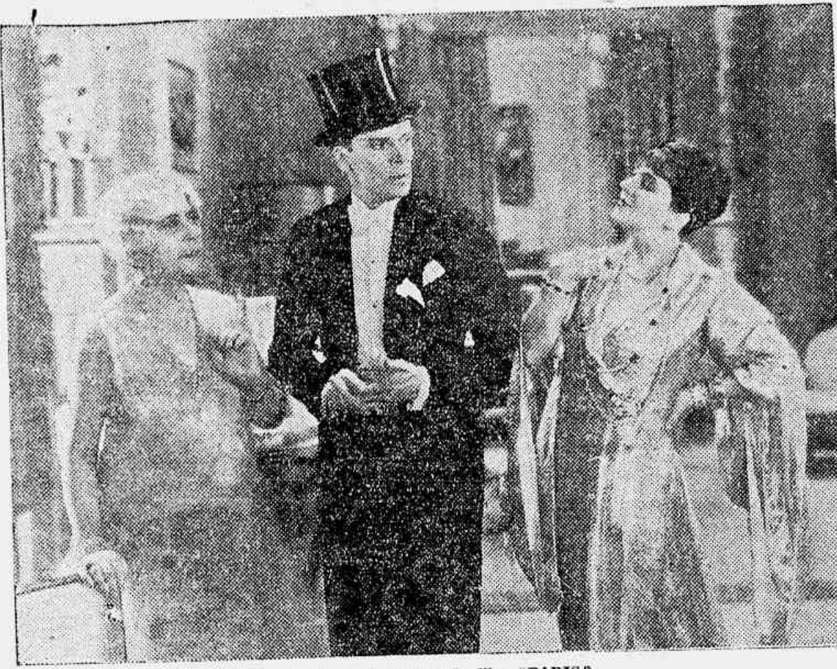
Uma scena do grande film "PARIS"

Cresce o interesse publico pelo originalissimo concurso da FIRST NATIONAL