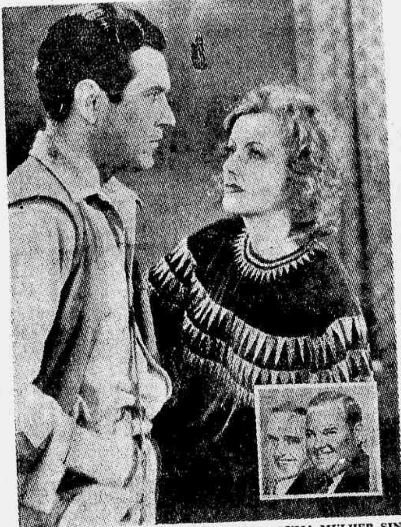
Já amanhã, a paixão de Greta Garbo em "UMA MULHER SINGULAR", amada por Nils Asther e John Mack Brown, estará no alma do Rio de Janeiro, que também "estourará" de rir com "PIRATAS DE MEIA-CARA", toda falada em hespanhol por Laurel e Hardy. E' um programma espantoso, o do Palacio, amanhã, como se vê!

Conrad Veidt e Mary Philbin, são as duas figuras, que, no proximo dia 10, levarão ao Pathé Palace, a assistir a esta soberba super-sonora da Universal, os seus numerosos admiradores.