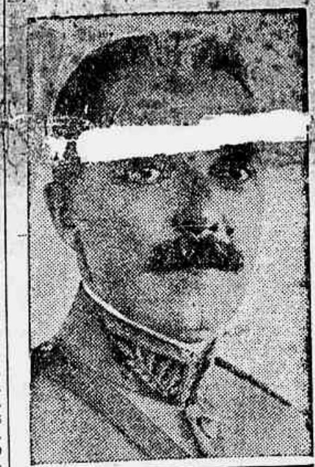
O ministro da Guerra que manda ordens ao commandante do 22º B. C. aquartela na Parahyba

As noticias que chegam aqui de victorias dos cangaceiros são inteiramente falsas. Apenas uma pequena força de 50 praças em expedição no povoado de Patos, foi envolvida por