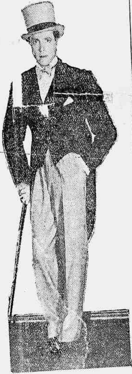
Jack Buchanan, o galã de Irene Bordoni em "Paris"