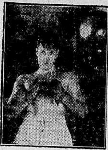
Richard Arlen estará, amanhã, no Glória, em "Ferro a Ferro"

Este bizarro título pertence ao filme que o Glória nos dará amanhã — uma espécie de vista panorâmica dos Estados Unidos nas duas décadas passadas, abraçando também ainda uma parte dos tempos que não de vir.