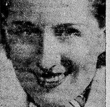
Norma Shearer vai apparecer como Nina Leeds "Mentiras da Vida".