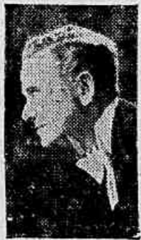
Roger Pryor, o cantor da voz de velludo

Está exigindo uma permanencia mais demorada em cartaz na Cinelandia, e para atender a esta vontade geral, é que a United marcou uma segunda phase de exhibições que se realiza desta vez, no Imperio.