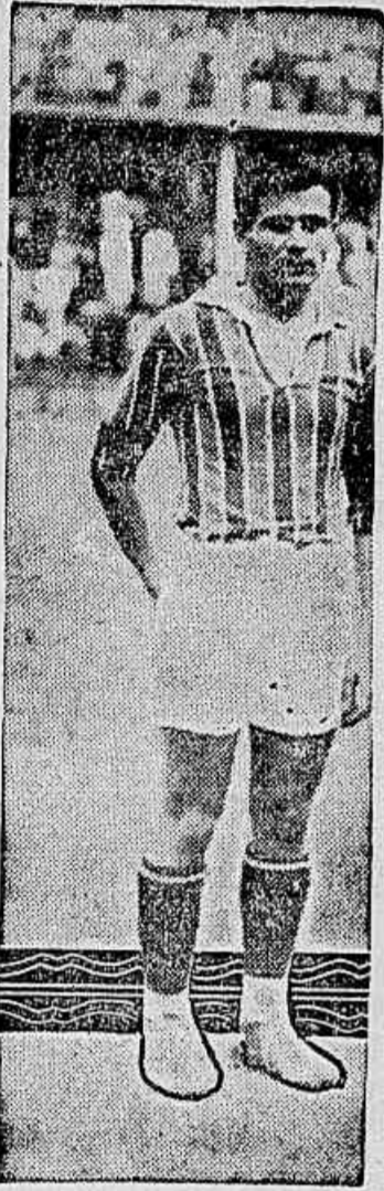
Prego, que deverá ser o meia esquerda do scratch

COGITA-SE DE FAZER O ENCONTRO EM BENEFICIO DA A. C. D.