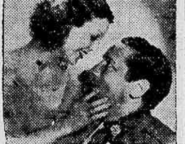
Loretta Young e Victor Jory, em "Vidas sem Rumo" que a Fox apresentará segunda-feira no Broadway

Esta pellicula da Fox relata a historia de um punhado de legionarios, tendo cada qual o seu romance, procurando nas aventuras arriscadas, o esqueci-