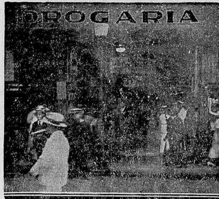
Aspecto da Drogaria Sul-Americana, onde os remedios são quasi

COMO OS SRS. SILVA GOMES & CIA. EXPLICAM OS SUCESSOS DO SEU COMMERCIO PHARMACEUTICO