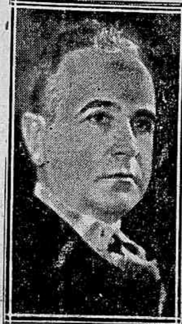
Sr. Getúlio Vargas

O SR. OSWALDO ARANHA FALA AO DIARIO CARIOCA SOBRE A MOMENTOSA QUESTÃO