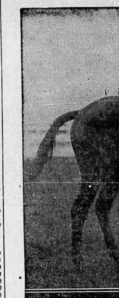
MIDI, a excelente egua nacional, que ante-hontem triumphou no Grande Premio "Guanabara"