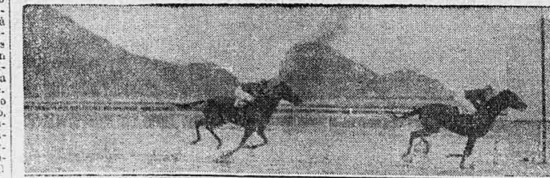
MANGO derrota MURICY no Premio "14 de Mayo"