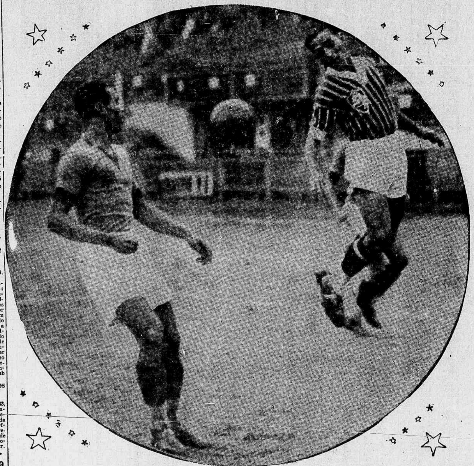
Sobral e Fraga empenhados na conquista da pelota. (Phase colhida durante o jogo Fluminense x Bomsucesso)