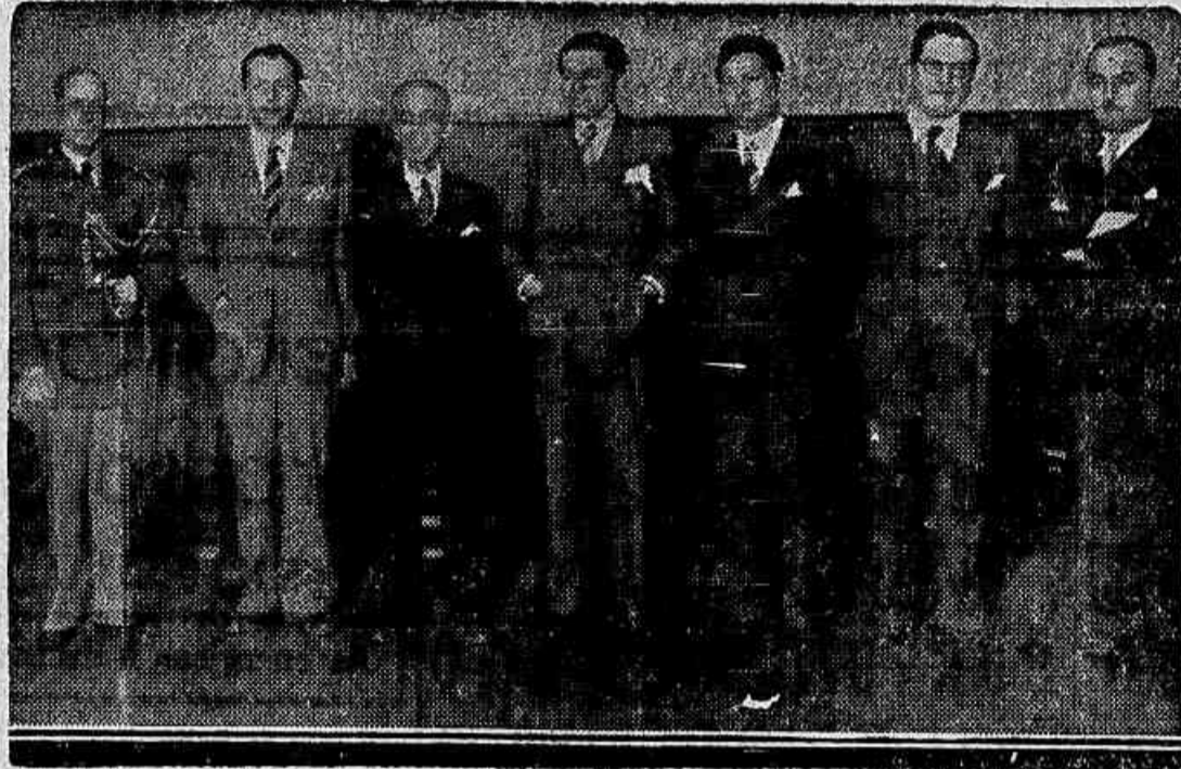
A delegação paraguaya quando foi recebida hontem na sede da A. B. I.