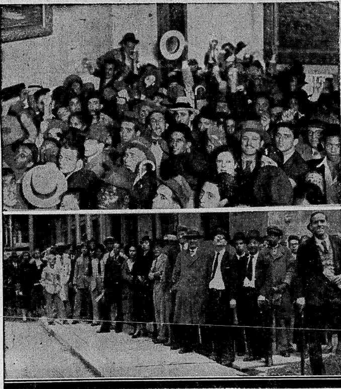
Dois aspectos do atropelo que se verifica no serviço de recebimento da penna dagua

Sob o pretexto de exigencias do serviço, admittiram-se cerca de 100 funcionarios, mas o serviço continua a ser feito entre os maiores atropelos