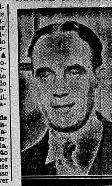
Sr. Armando de Salles Oliveira

O sr. Armando de Salles Oliveira chegou ha dois dias de São Paulo, tendo desta vez viajado por mar. O governador paulista já está refeito da ultima operação soffrida, tendo vindo ao Rio para tratar de assumptos e problemas ligados á administração daquelle Estado. Recebendo, hontem, os jornalistas, em seu apartamento do Palace-Hotel, o sr. Armando de Salles Oliveira expoz os motivos que o trouxeram até aqui, falando com o maior desembaraço e franqueza. Os reporteres ponderaram de inicio que o governador paulista estava na obrigação de fazer declarações politicas, conforme a velha praxe adoptada. Acontece ainda que a successão presidencial já começou a ser debatida, de modo que o chefe do governo do mais poderoso Estado brasileiro tem o dever de adiantar algumas palavras. Com a sua gentileza de sempre, o governador paulista ou-