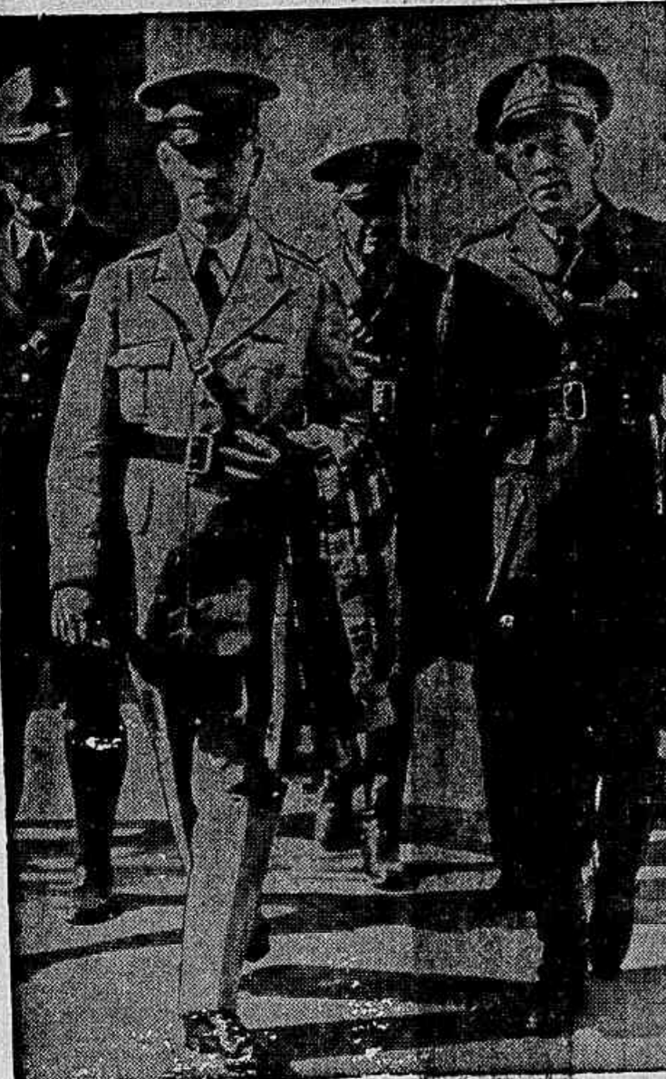
Officiaes do Exército federal dos Estados Unidos enviados para Louisiana, afim de com baterem o movimento de reaccção preparado all pelo senador Huey Long

cia do attentado contra o senador por aquelle Estado, sr. Huey Long e que era, de facto, uma das figuras mais populares da actualidade americana. Representava, no Senado da grande nação, o Estado de Louisiana, mas o seu prestigio era nacional. Recentemente, os jornaes de Nova York e de outras cidades do paiz affirmaram que se fosse candidato á suprema magistratura da Nação, alcançaria, já neste momento, 10.000.000 de votos. Por que? Porque representava, na hora de incertezas em sua patria e no mundo inteiro, algumas aspirações populares, e um programma utópico, certamente, mas que atrahia o sentimento publico.