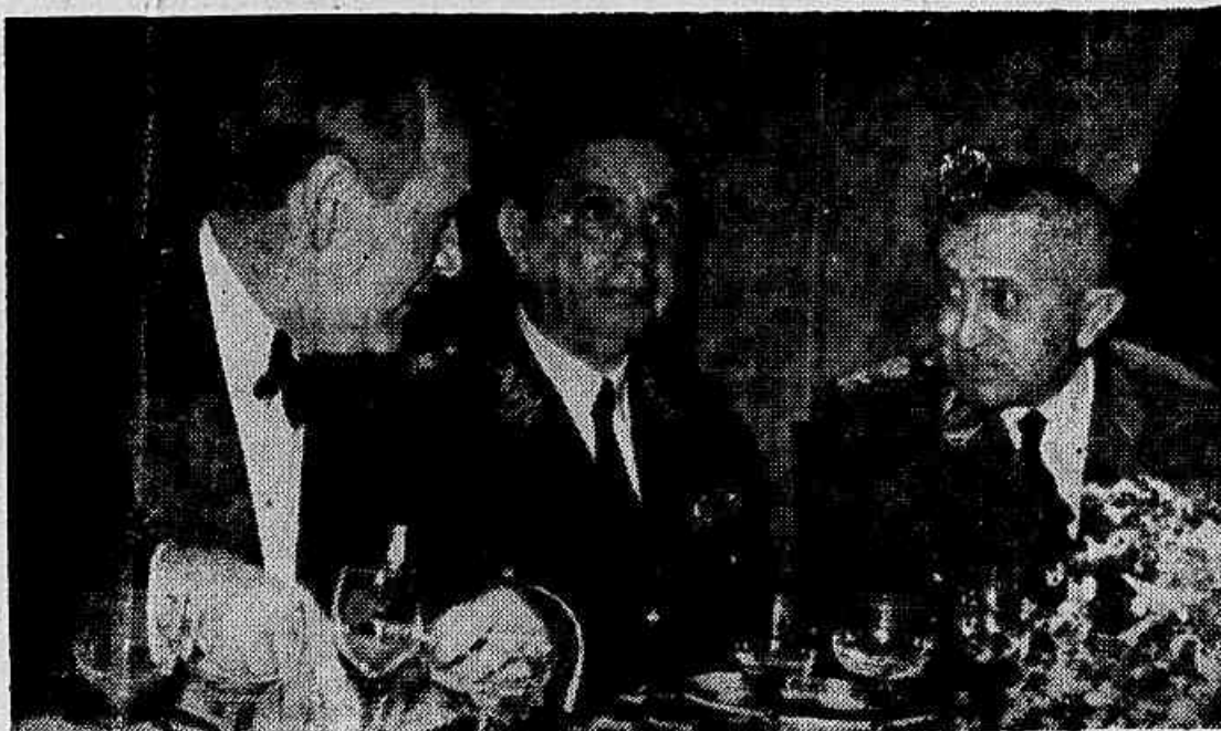
Um aspecto do banquete, vendo-se o homenageado entre os ministros Eurico Gaspar Dutra e Oswaldo Aranha