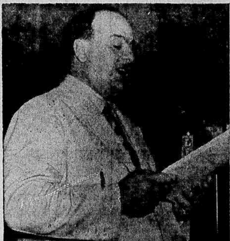
O sr. Souza Costa, quando pronunciava sua conferencia

O sr. Arthur de Souza Costa, ministro da Fazenda, proferiu, hontem, no Palacio Tiradentes, a sua annunciada conferencia sobre o panorama economico-economico da Republica.