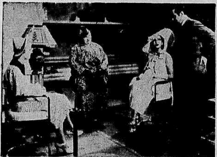
Os interpretes de "Bonequinha de Seda"

O Film Que Fez o Brasileiro Orgulhar-se da Sua Industria Nacional