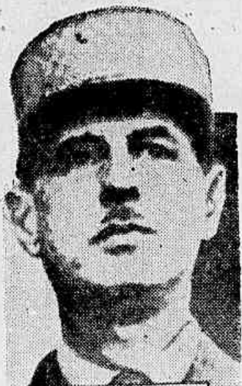
GRAL DE GAULLE

LONDRES, 29 (U. P.) O general Charles De Gaulle annunciou hoje, em uma allocução pelo radio dirigida a França que as forças francezas