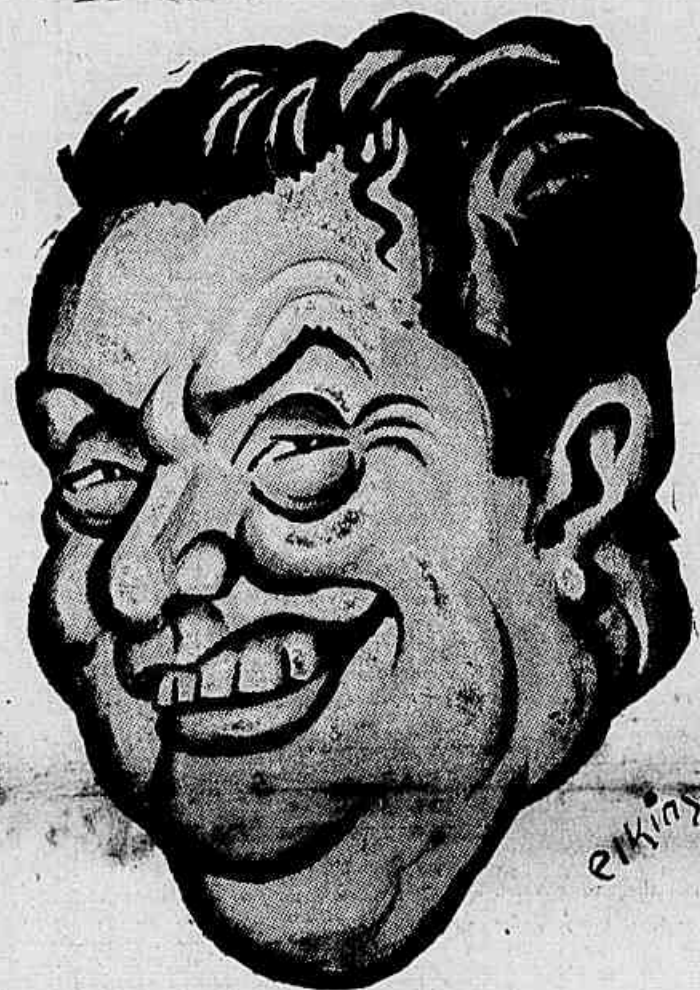
GENERAL GÓES MONTEIRO