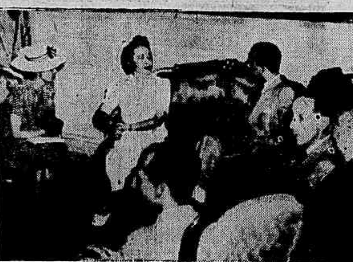
A SENHORA DARCY VARGAS PRESIDE UMA REUNIAO DA ASSOCIAÇÃO DO LAR PROLETARIO — Teve lugar, na tarde de hontem, no Palacio Guanabara, uma reunião da directoria da Associação Lar Proletario. Como se sabe essa entidade, sob os auspícios da senhora Darcy Vargas, está construindo, para a população que mora nos morros, cerca de seiscentas casas em terrenos à rua da Alegria e à margem da Rio-Petropolis. Durante mais de uma hora madame Getulio Vargas esteve tratando de varios assumptos da entidade, estando presentes ainda os representantes da Municipalidade e do chefe de policia. A nossa objectiva focalizou, durante a reunião, o flagrante que illustra este texto.