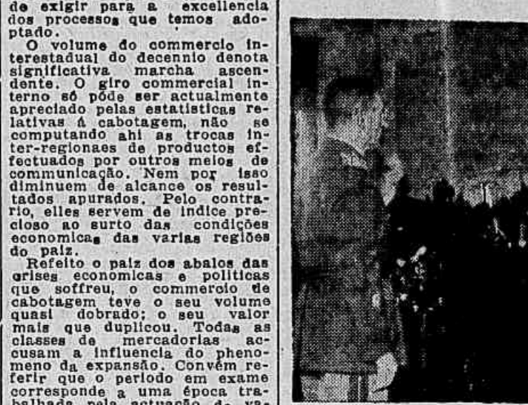
O general Almerio de Moura quando prestava o juramento de praxe

Tomou posse hontem, ás 14 horas, do cargo de ministro do Supremo Tribunal Militar, o general Almerio de Moura.