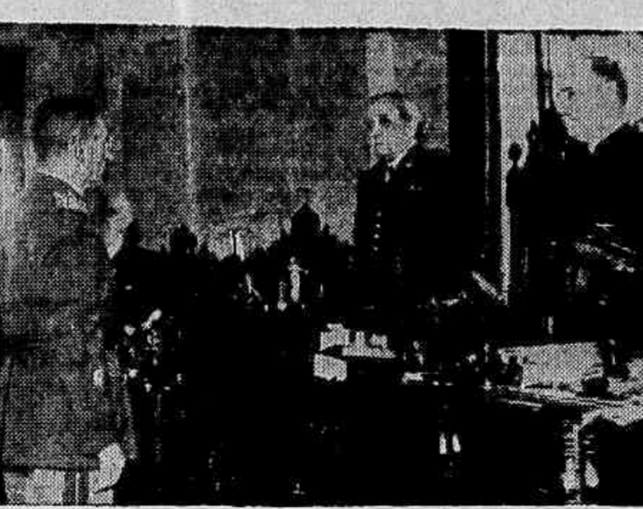
O general Almerio de Moura quando prestava o juramento de praxe

Tomou posse hontem, ás 14 horas, do cargo de ministro do Supremo Tribunal Militar, o general Almerio de Moura.