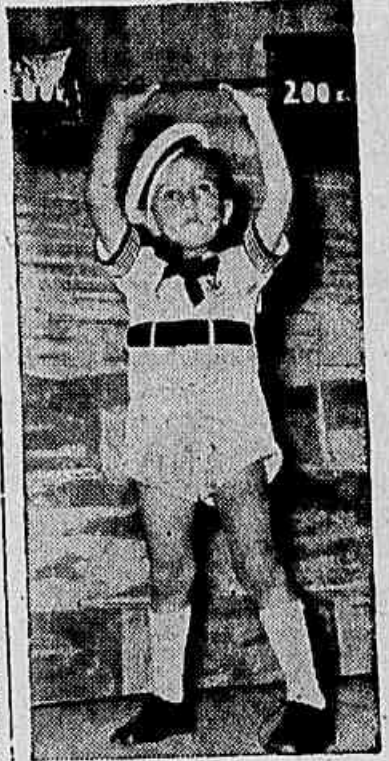
Flagrante colthido, em pleno palco, durante a festa infantil de hontem no theatro do Casino Copacabana

Na sua edição de amanhã, DIARIO CARIOCA publicará o resultado das votações obtidas por todas as candidatas, e bem assim as impressões que foram colhidas durante o periodo da apuração.