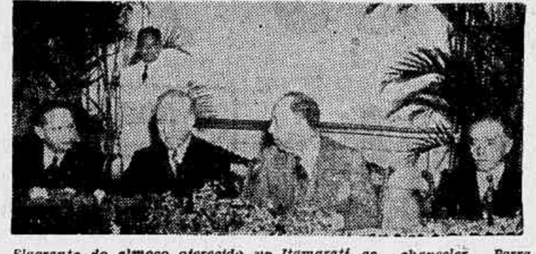
Flagrante do almoço oferecido no Itamarati ao chanceler Parra Perez