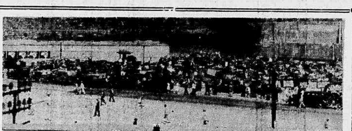
A "Piramide Brasil", junto a qual o "Diario da Noite" homenageará hoje o DIARIO CARIOCA