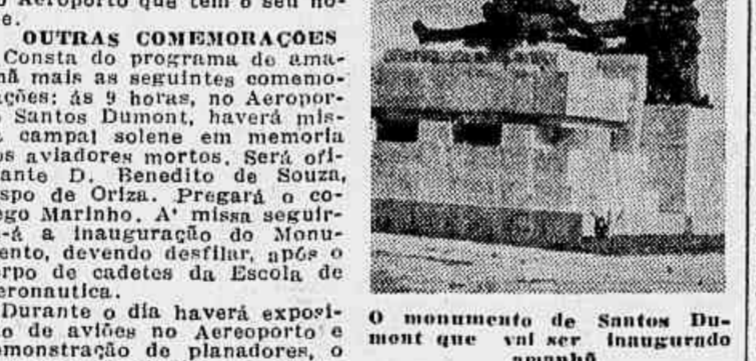
O monumento de Santos Dumont que vai ser inaugurado amanhã