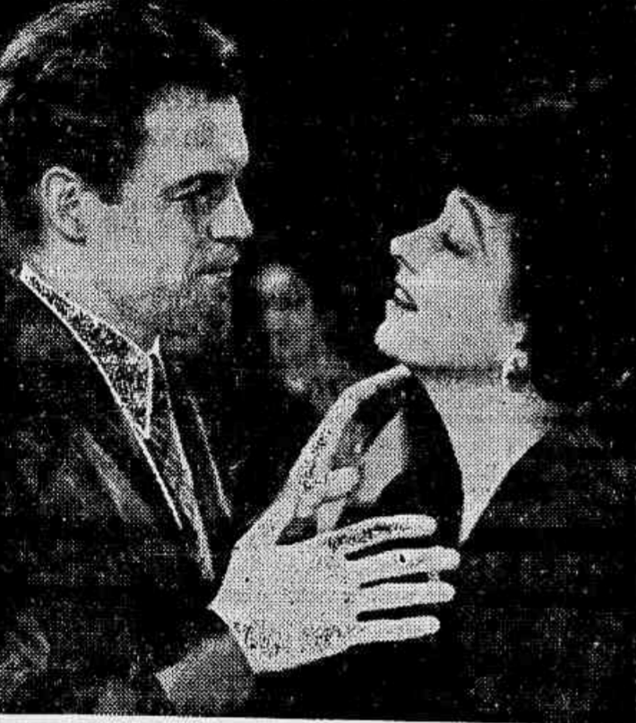
Kay Francis e Van Hefflin, as "diferenças" de Rosalind Russell e Don Ameche em "Clumsy não é Pecado", a estréia de hoje no Metro-Passeio

Hoje, no "Metro-Passeio", Uma Estréia Elegante Garantida por Rosalind Russell, Don Ameche, Kay Francis e Van Hefflin!