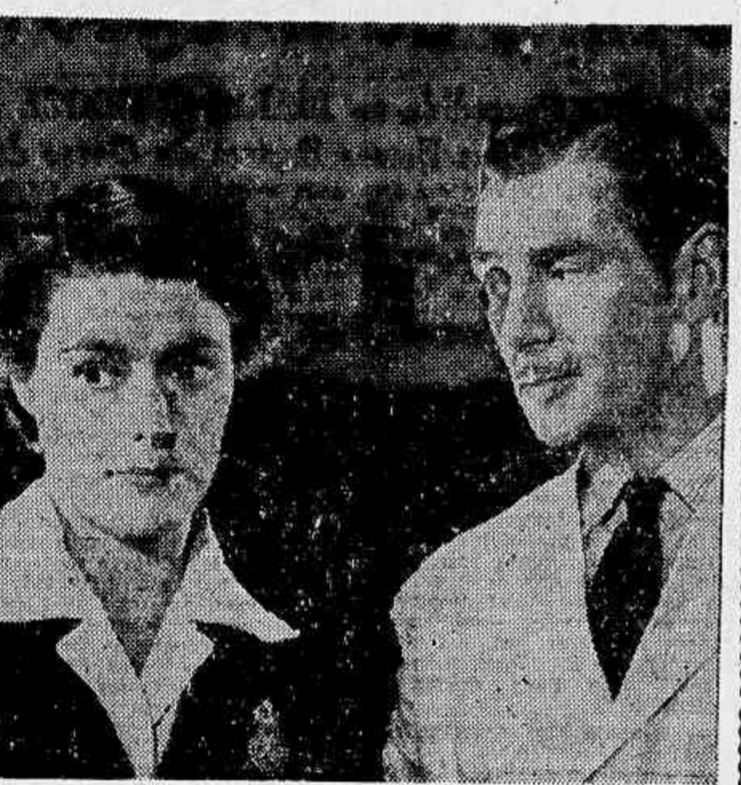
Barbara O'Neill e James Stephenson

Para aquele marido-aquele professor austero, solene, cheio de idéias, com as quais ninguém concordava... clumsy era bobagem... Dizia-o em termos empolados, e claro, e a respeito chegou a escrever um livro.