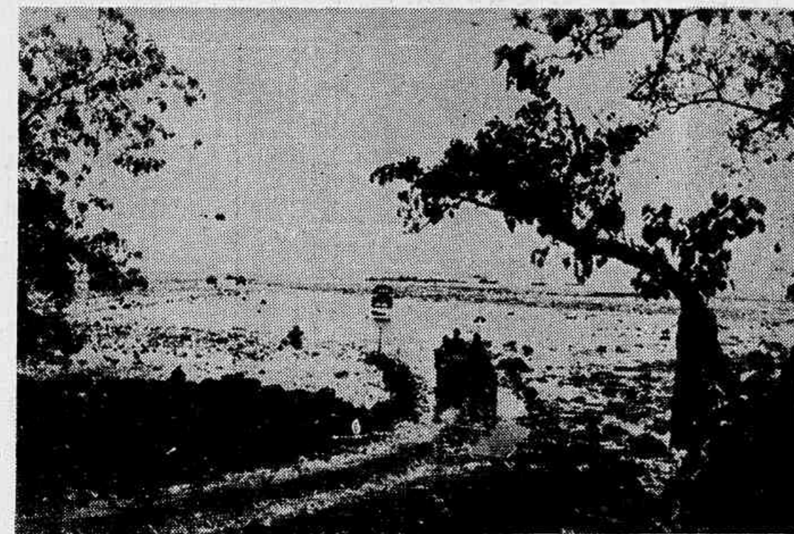
Depois da desembarque da vanguarda americana em Guadalcanal os "Jeeps" e caminhões do exercito fazem o transporte de viveres e munições para os bravos que tomaram conta do importante ponto aliano.