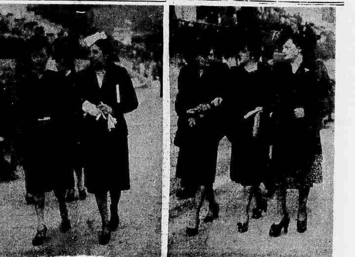
TARDE DE ESPORTE E ELEGANCIA NO HIPÓDROMO DA GAVEA — Bellíssima foi a tarde turística de domingo ultimo, no majestoso Hipódromo da Gavea onde, entre outros puros, se disputou o "Grande Premio Derby Club". Reunindo autenticos "cracks", a carreira principal do programa foi farta de emoções e Bagual, o favorito, confirmou a sua classe, vencendo este puro. Como sempre sucede em todas as reuniões que o Jockey Club Brasileiro promove, um avultado numero de aficionados acorreu á pista da Gavea dando, assim, um aspecto imponente ao "meeting" desportivo. Faça foi, pois, o nosso fotografo, recolher em sua objetiva os expressivos flagranes que estampamos, nos quais aparecem algumas das muitas graciosas patricias quando, durante os intervalos dos puros, passeavam pela "pelouse".

ILESOS OS TRIPULANTES COLONIA ALVEAR (Argentina), 21 (U. P.) — Urgente — O avião extraviado aterrissou numa localidade denominada Agua Escondida situada a 350 quilômetros de General Aivear devido a falta de combustível. A desida foi efetuada em perfeitas condições. Os tripulantes se encontram em perfeito estado de saúde.