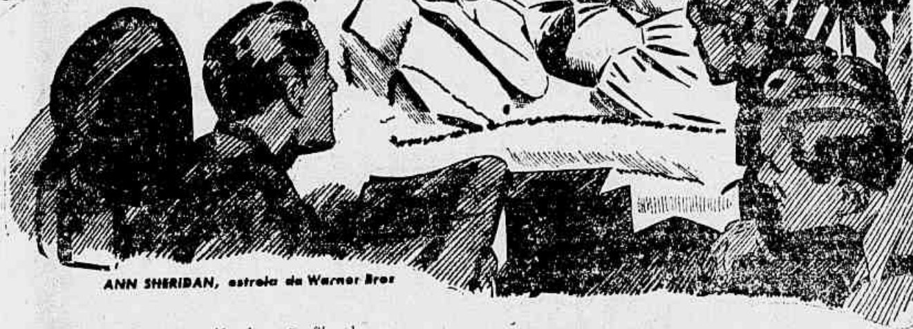
ANN SHERIDAN, estrela da Warner Bros

Novas Estrelas, novas películas são filmadas em todo o mundo pelo equipamento Photophone RCA, usado nos principais studios onde quer que se produzam os melhores filmes, como em Hollywood, Argentina, Austrália, Brasil, Chile, Inglaterra, Índia, México, Rússia, Espanha, Turquia.