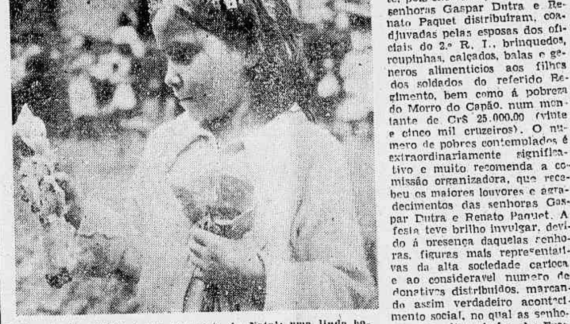
Esta criança ganhou o seu presente de Natal: uma linda boneca. A expressão do seu olhar tem alguma coisa de embelezado. Contempla a dinda do Papai Noel, embolado, malhado, vem um sorriso nos lábios. Talvez a criança lhe tivesse tirado esse sorriso, mas os olhos da mãe não deixam de olhar para o filho.

A Distribuição dos Cartões Nos Vinete e Dois Postos da Legião Brasileira de Assistencia — Dezenas de Milhares de Pessoas Foram Atendidas Ontem No Grande Parque do Palácio do Catete — Nos Ministerios da Marinha, da Aeronautica e No Quartel do 2.º R. I.