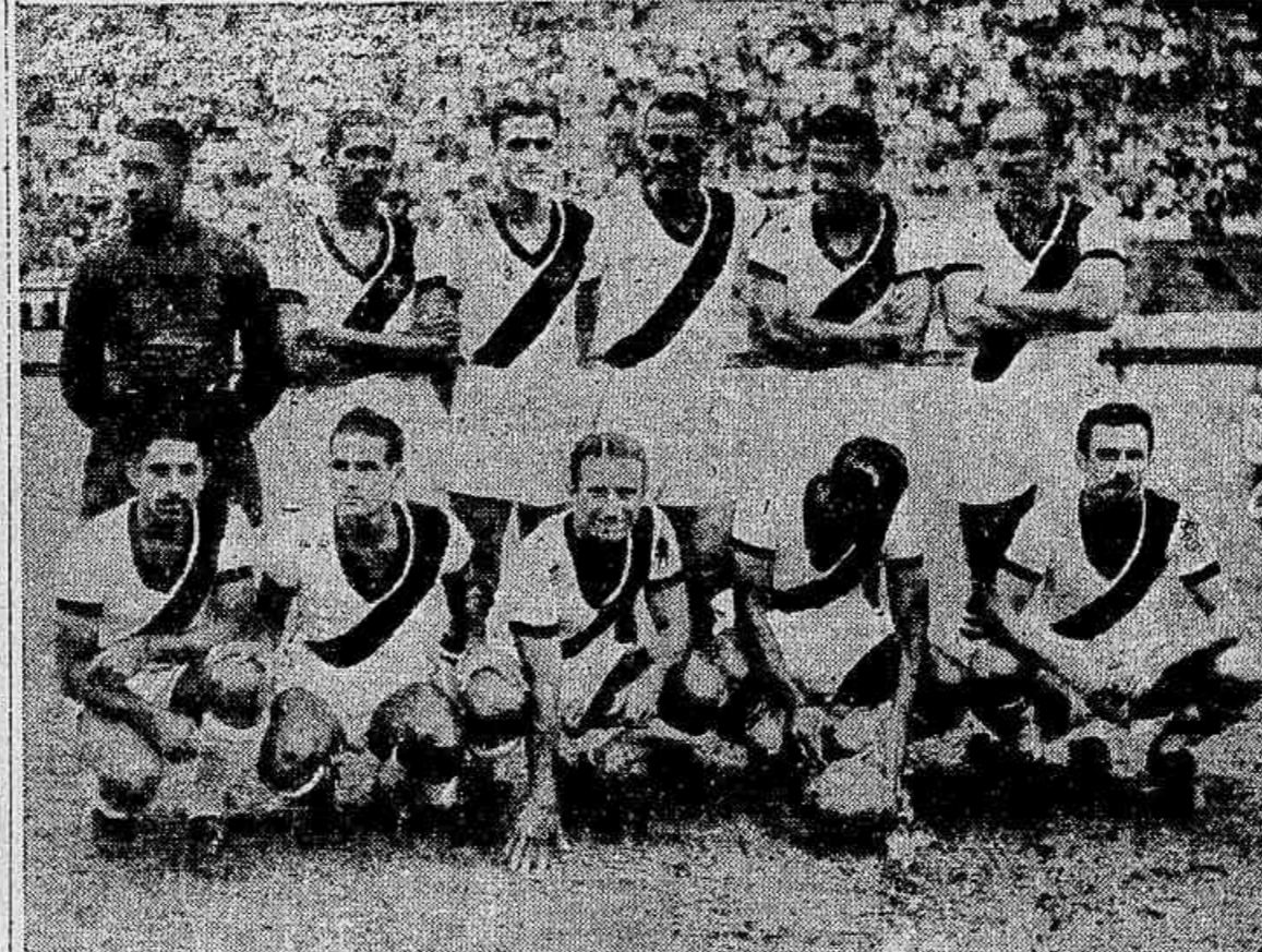
Os campeões vascaínos