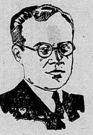
José Américo de Almeida