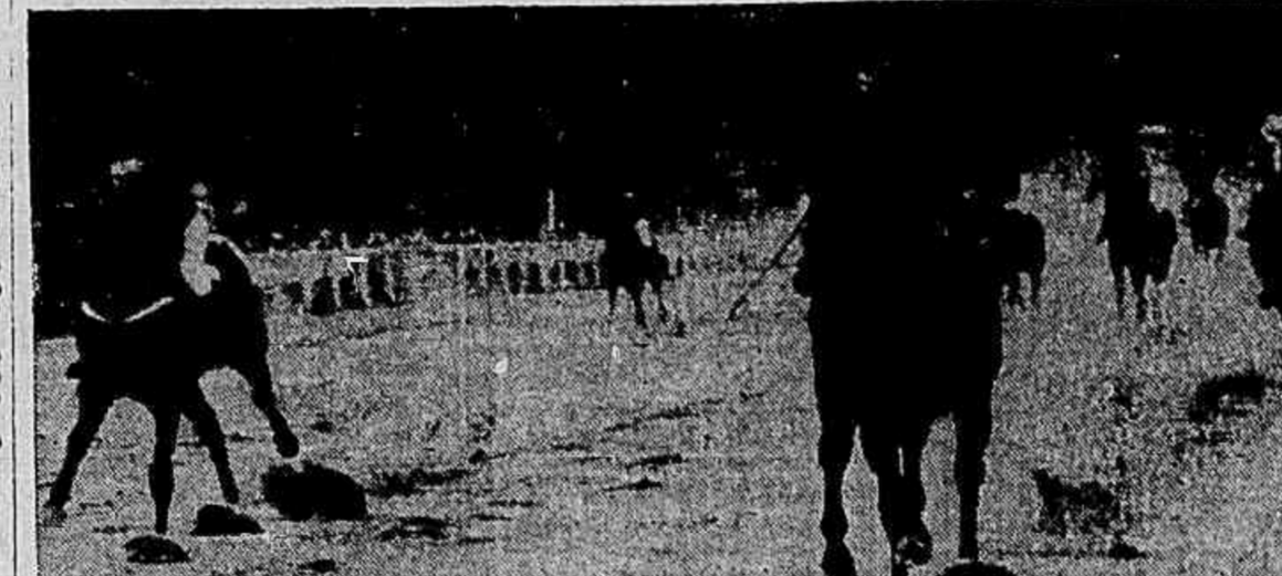
1) Brazilian Star reapareceu diferente. Chelo de "ganas" — como dizem os chilenos. Não contava, porém, com os 95" 2/5 do Itamby, um zaino que, segundo a nossa impressão, vai ganhar muitas corridas. Ullóu trouxe o irmão da Giruá "na boca", de nada valendo a "tocada" energica de "mestre" Reduzino.