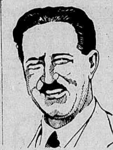
Ademar de Barros