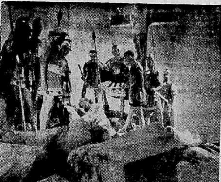
Uma cena do grandioso espetáculo "Jesus Nazaré", que está em exhibição no Odéon e Ideal.

Revivendo em todo o seu drama místico o mais empoignant da historia da humanidade, eis aí "Jesus de Nazaré", a maravilhosa produção mexicana que os cinemas Odéon e Ideal estão apresentando simultaneamente.