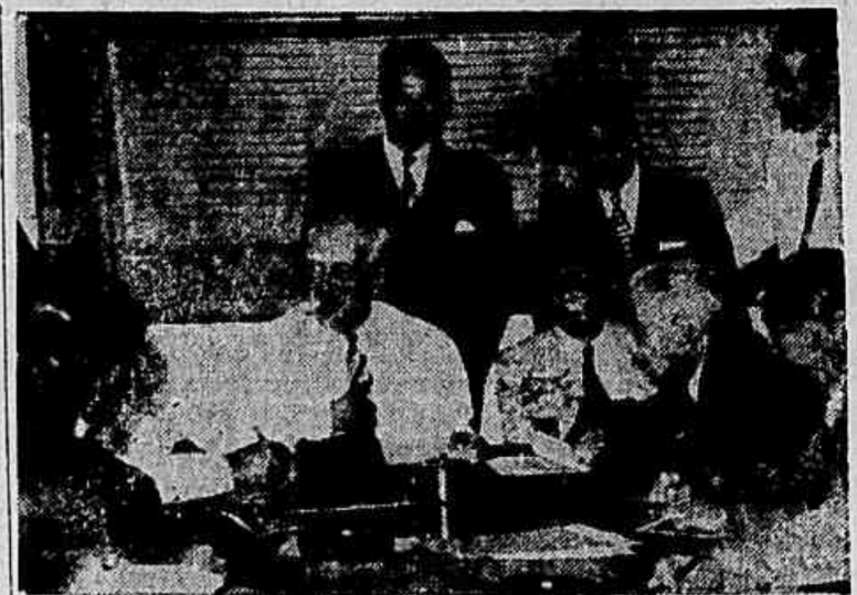
O embaixador Osvaldo Aranha, presidente da Assembleia da ONU, fala aos jornalistas

se as democracias apresentarem um bloco homogêneo e decidido a se opor às pretensões do imperialismo soviético a Rússia recuará de seus propósitos e será obrigada também a trabalhar pela paz. Ninguém desista de guerra, principalmente a Rússia, cuja produção aliada se encontra em situação inferior à dos Estados Unidos, em 1932, e que mesmo desenvolvendo o máximo de sua capacidade industrial somente em 1960 conseguirá alcançar o que os Estados Unidos já possuíam em 1915. A Rússia segue a sua política de "aproximação" isto é, cercada pelos russos procura uma saída através do Irã, visando alcançar os seus objetivos políticos e econômicos na Europa, onde a sua quinta coluna já vem ativamente preparando um clima capaz de comprometer os governos democráticos e oferecer oportunidade para a implantação dos governos que gravitam sob a órbita do Kremlin. Devo chamar a atenção de todos para a gravidade dos problemas inerentes a esse momento em que sofremos a angústia da aproximação de uma nova guerra. Essa nova guerra nos atingirá em nossas próprias casas, e ela não podendo ficar indiferente em único povo ou nação. Não nos limitaremos a enviar soldados a ultramar. Os