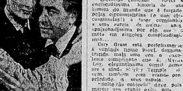
Katharine Hepburn e Paul Henreid em "Sonata de Amor".

Katharine Hepburn interpreta genial pianista Clara Schumann.