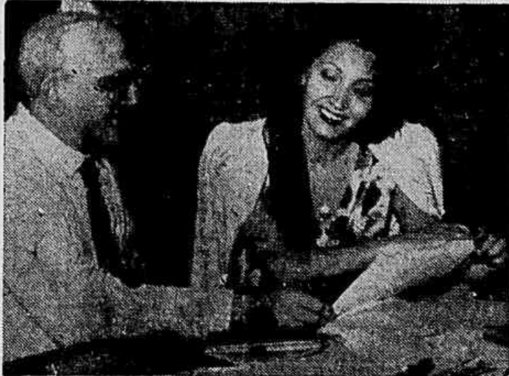
GLORIA BARA NO "DIARIO CARIOCA" — Nas vespertais de sua estrela no João Caetano, Chianca de Garcia mobiliza todos os valores do teatro musicado no Brasil e no estrangeiro. Aínda agora contratado em Buenos Aires a famosa ballarina de danças espanholas Gloria Bara, que será uma das autenticas novidades de "Beijos, abraços, amor!". Esta foto é de sua visita ao DIARIO CARIOCA, onde contou os seus projetos na Temporada que se aproxima

Companhia Nacional de Navegação São João da Barra e Campos — Achem-se á disposição dos Senhores Acionistas na Sede da Companhia, á Av. Marechal Camara n.º 350 — 5.º andar, os documentos de que trata o artigo 99 do de. creto-lei n.º 2627, de 26 de Setembro de 1940. Rio de Janeiro, 24 de Março de 1948 — A DIRETORIA.