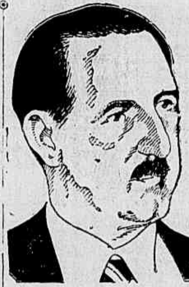
Ademar de Barros