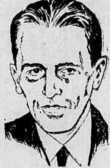
Luis Carlos Prestes