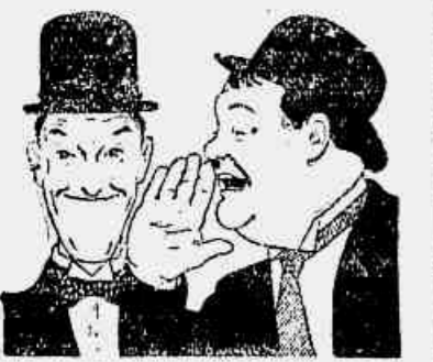
Laurel e Hardy, empenhados em "Politiqueques", agora...

STAN LAUREL PARA SALVAR A CANDIDATURA DE OLIVER HARDY. EM "POLITIQUEQUES", FAZ UMA LUTA SENSACIONALISSIMA... E COM UMA MULHER: