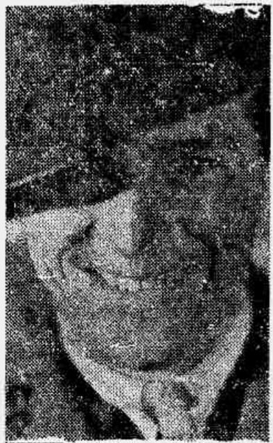
Douglas Fairbanks Jr., em "Chance!", é maior que a "Patrulha da Madrugada"

DOUGLAS FAIRBANKS JR. EM UM FILM DIGNO DO SEU VALOR: "CHANCE!", DA WARNER FIRST