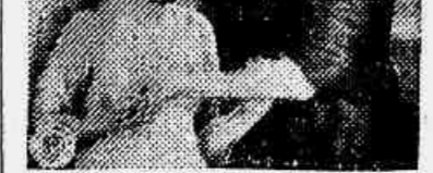
Karin Evan e Conrad Veidt

"SEDUCCAO DE MULHER", UM ADMIRA FILM DA UNIVERSAL