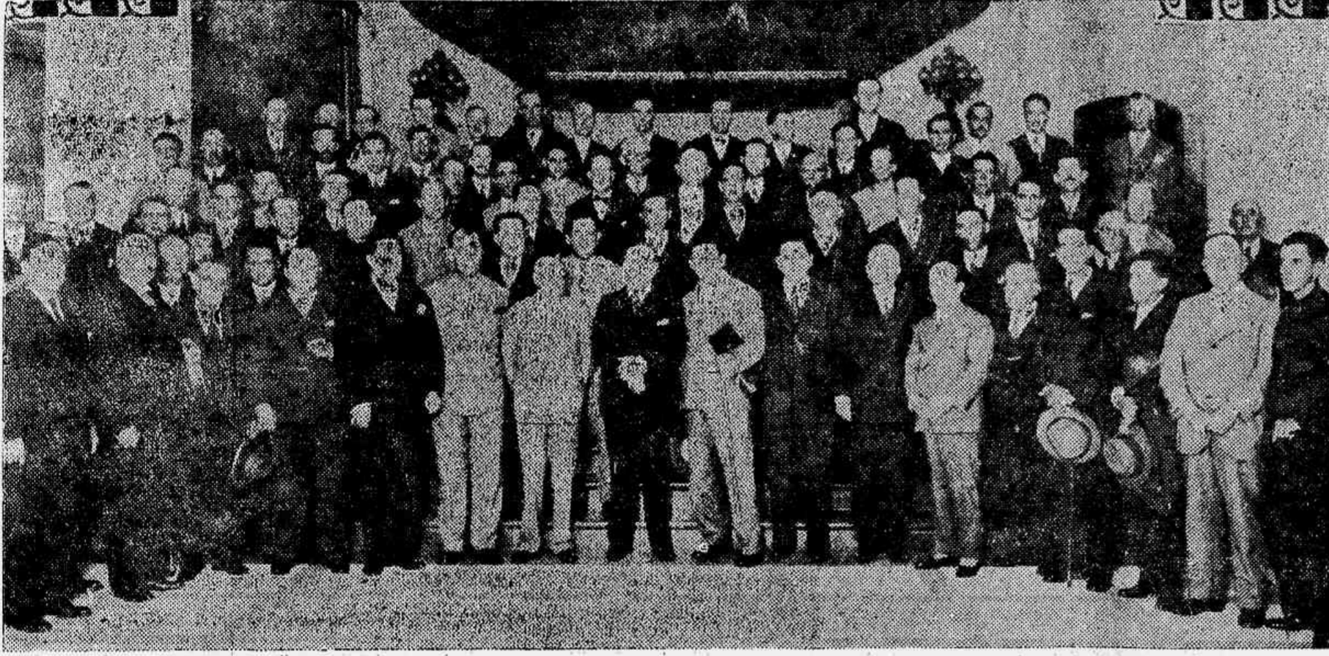
Os prefeitos riograndenses que tomaram parte no banquete de segunda-feira ao sr. João Neves da Fontoura. Vê-se no primeiro plano, ao centro, o sr. Flores da Cunha (Photographia tirada no dia 23 do corrente, no palacio do governo gaúcho)

Deve o povo carioca recebê-lo carinhosamente, cobrindo-o de flores, no dia do seu regresso ao Rio, porque o "leader" gaúcho empunha a bandeira da soberania sempre defendida pelo espirito altivo da cidade