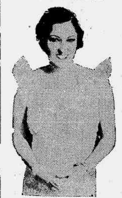
Gloria Swanson em "Indiscreta"

O ELENCO DE "INDISCRETA", DA UNITED ARTISTS