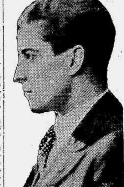
Ramon Novarro... Segunda-feira elle reaparecerá em "Sevilha de meus amores"

NÃO HA QUEM NÃO QUEIRA VER "SEVILHA DE MEUS AMORES" NOVAMENTE