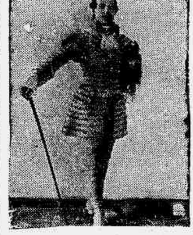
"Monsieur Beaucaire", a maior criação de Rodolpho Valentino, voltará ao "ecran" segunda-feira, numa nova versão synchronizada em "O ultimo pelotão"