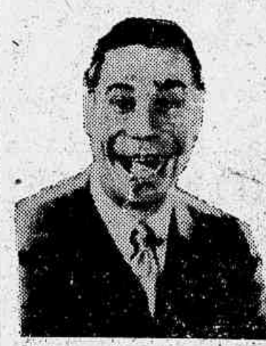
Uma boca capaz de engulir o Pão d'Assucar, isto é, Joe E. Brown, estrará segunda-feira, no Odeon, em "Fogo e Função"

Que noites brilhantes teve o Palacio Theatro, ante-hontem e hontem! E que triumpho exoropolonal, o de "Possuیدا", esse film apaixonante que Joan Crawford e Clarke Gable viveram para a Metro-Goldwyn Mayer e que será, até domingo, o cartaz victorioso do Palacio Theatro.