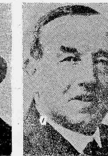
Arthur Henderson, presidente da Conferencia do Desarmamento