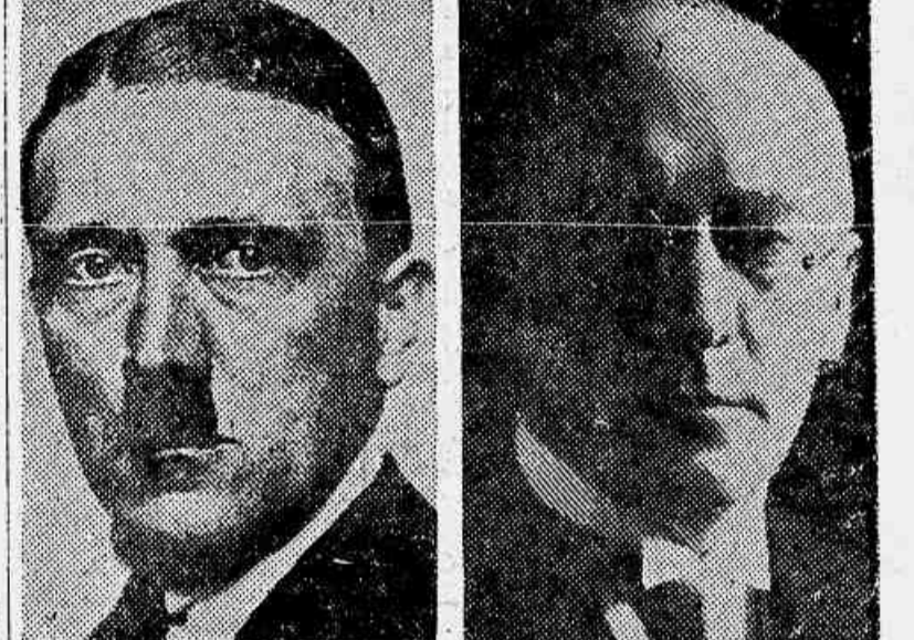
Hitler, o "leader" dos naciona-socialistas Bruening, chefe do gabinete demissionario

Hitler será a figura dominante no scenario politico allemão — Os motivos do desacordo entre Hitler e Hindenburg — A impressão causada pela demissão de Bruening nos Estados Unidos