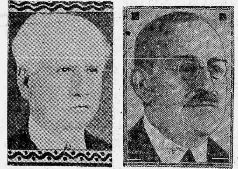
Sr. Assis Brasil, embaixador brasileiro General Justo, presidente da Argentina

Os ultra proteccionistas vão envidar esforços para que sejam mantidos os regulamentos existentes — O ministro da Agricultura defende a redução das taxas que gravam a herva matte