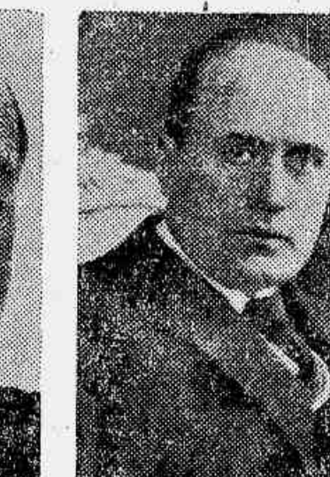
Mussolini, primeiro ministro da Italia, signatario dos accórdos de Locarno

No momento, em que a Conferencia do Desarmamento se esforça para realizar alguma coisa de definitivo em favor da limitação dos armamentos, baseado-se no projecto de Convenção, elaborado pela Comissão Preparatoria, e interessante recapitular, sumariamente, os esforços que vem realizando a Sociedade de Genebra, para attingir o grande ideal, cuja difficuldade não deve determinar esmorecimento.