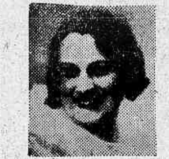
HOJE A's 8 e 10 horas Duas representações de