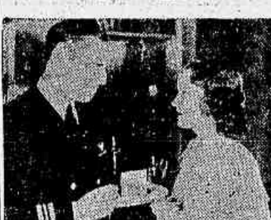
Fay Wray e Ralph Graves, que têm em "Dirigível", com Jack Holt, um desempenho admirável

John Gilbert vive a figura de um homem apaixonado, um homem que se vê despedido pela mulher dos seus sonhos e que se serve de uma outra que o adora, mas a quem elle não ama, unicamente para fazer adiante a que o esqueça... E o venço, depois, arrependido do se ter servido da que verdadeiramente o amou, unicamente por adiante. É mais um perfeito trabalho do "Gigante da Expressão. John Gilbert é sempre John Gilbert.