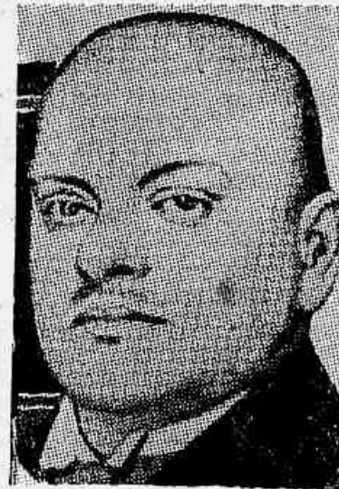
Stresemann, um dos grandes autores dos famosos accórdos de Locarno