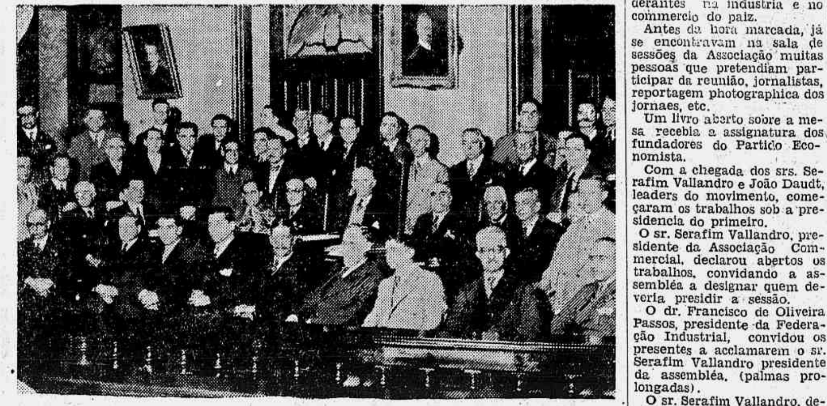
Um aspecto da numerosa assistencia no salão da Associação Commercial, hontem, á tarde, quando da discussão das bases fundamentais do Partido Economista

Falaram varios oradores, encarando a necessidade da fundação de uma corporação politica que defende o interesse das classes conservadoras sem descurar-se de seus deveres para com a collectividade — Foi nomeada uma comissão para redigir as bases do partido, que será fundado em assembléa publica, num dos theatros da capital