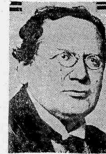
Litvinoff, ministro dos estrangeiros e chefe da delegação do Soviet, que propoz o desarmamento completo