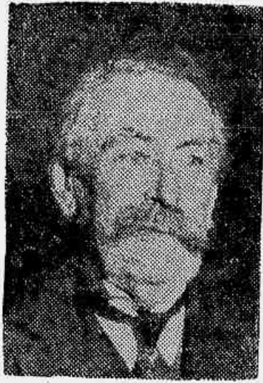
Briand, o grande autor do pacto Briand-Kellogg, de importancia moral extraordinaria.