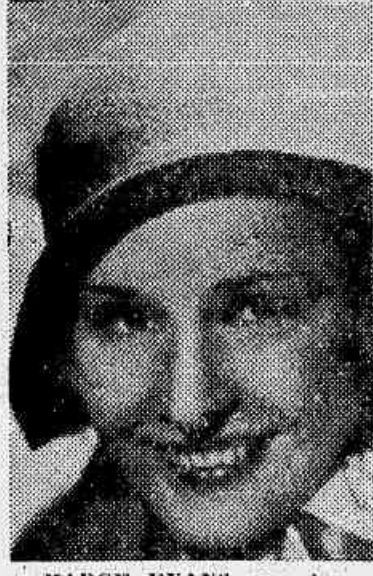
MADGE EVANS, um dos amores de John Gilbert, em "Longe da Broadway", que o Palacio estrará segunda-feira

"Deliciosa" tem na presença de Janet Gaynor e Charles Farrell uma das razões decisivas do seu successo.