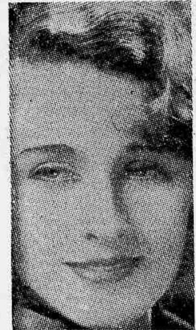
NORMA SHEARER, a mulher irresistivel que estrá no Palacio, dia 13, em "Vidas particulares"

A grande dificuldade, para quem vê "Dirigível", esse film portenoso que o Broadway não apre-