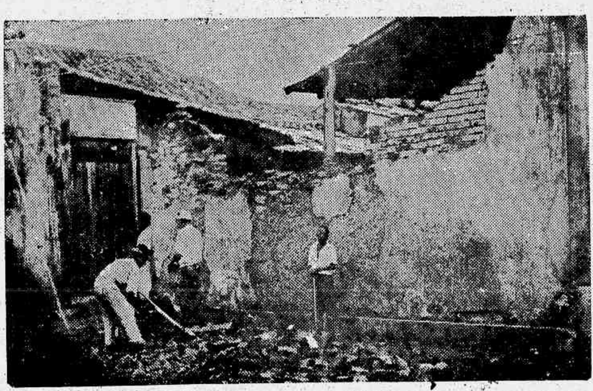
Um aspecto do desabamento ocorrido á rua General Pedra

Além do prejuizo material, registraram-se mortes e ferimentos