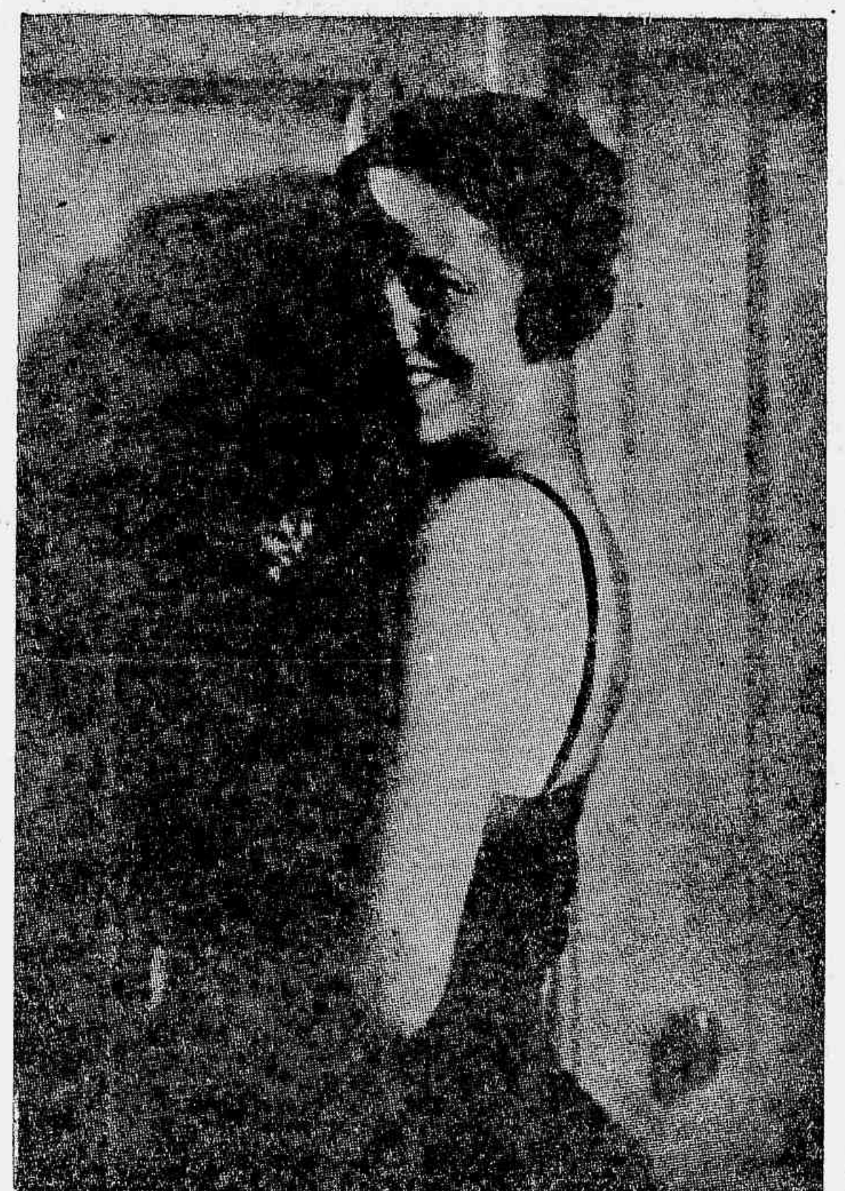
No claro-escuro malicioso do "abat-jour"...

O telephone e o "abat-jour" - Uma observação do poeta do "Passaro Cégo"