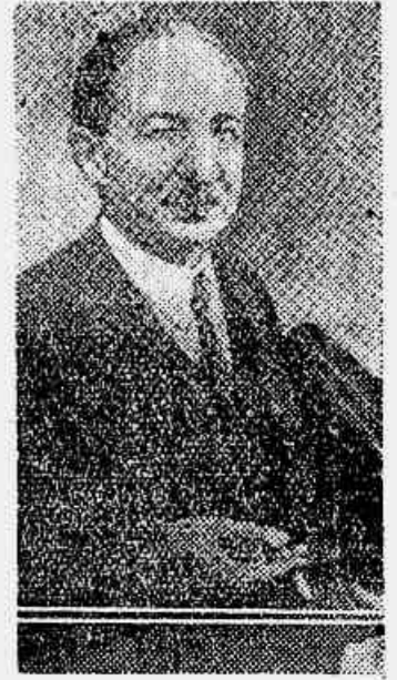
Sr. Yvon Delbos

O telegramma salienta que a disputa não envolve o choque dos interesses nacionaes da Turquia e da França, mas sim uma divergencia entre o pedido dos turcos, da independencia de Alexandretta, e as estipulações do mandado de que a França ainda goza sobre a Syria.