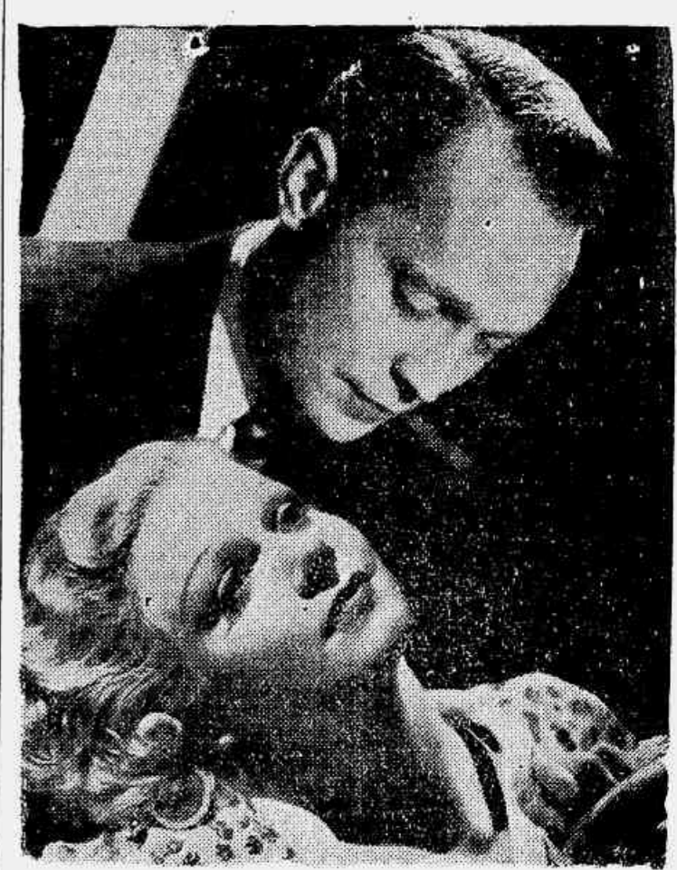
Jean Harlow e Franchot Tone, que ella ama em "Suzy". Mas ama, também, Cary Grant...

Robert Taylor e Barbara Stanwyck estão na tela do luxuoso cinema