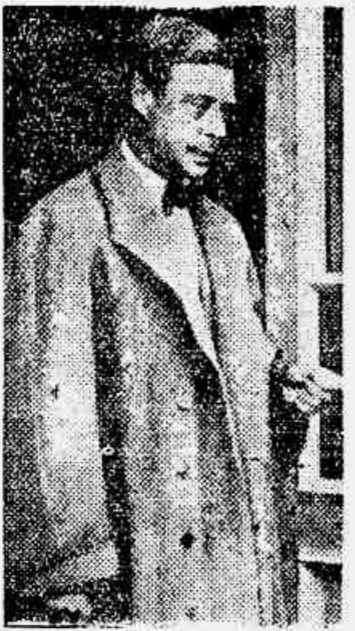
O ex-rei Eduardo VIII e a sra. Simpson

Aprecio profundamente o espirito que inspirou o desejo manifestado no sentido de que eu tomasse differente decisão. Antes de adoptar a minha final de-