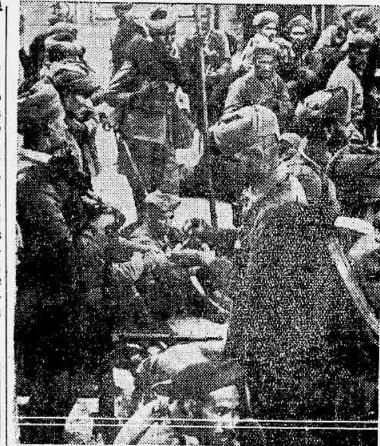
Soldados mouros em Madrid