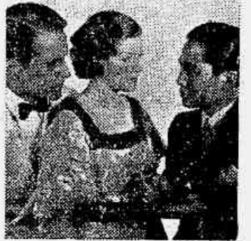
Uma scena de "Charlie Chan no Prado"

Amigo leitor, pode erer que este film emocionantissimo que a 20th. Century-Fox está annunciando para segunda-feira, no cinema Gloria, é o mais sensacional e o mais bem elaborado de toda a serie esplendida a que já nos habituou o admiravel detective Charlie Chan. Nesta nova aventura, vamos assistir novos moldes, novos mysterios, novas ameaças,