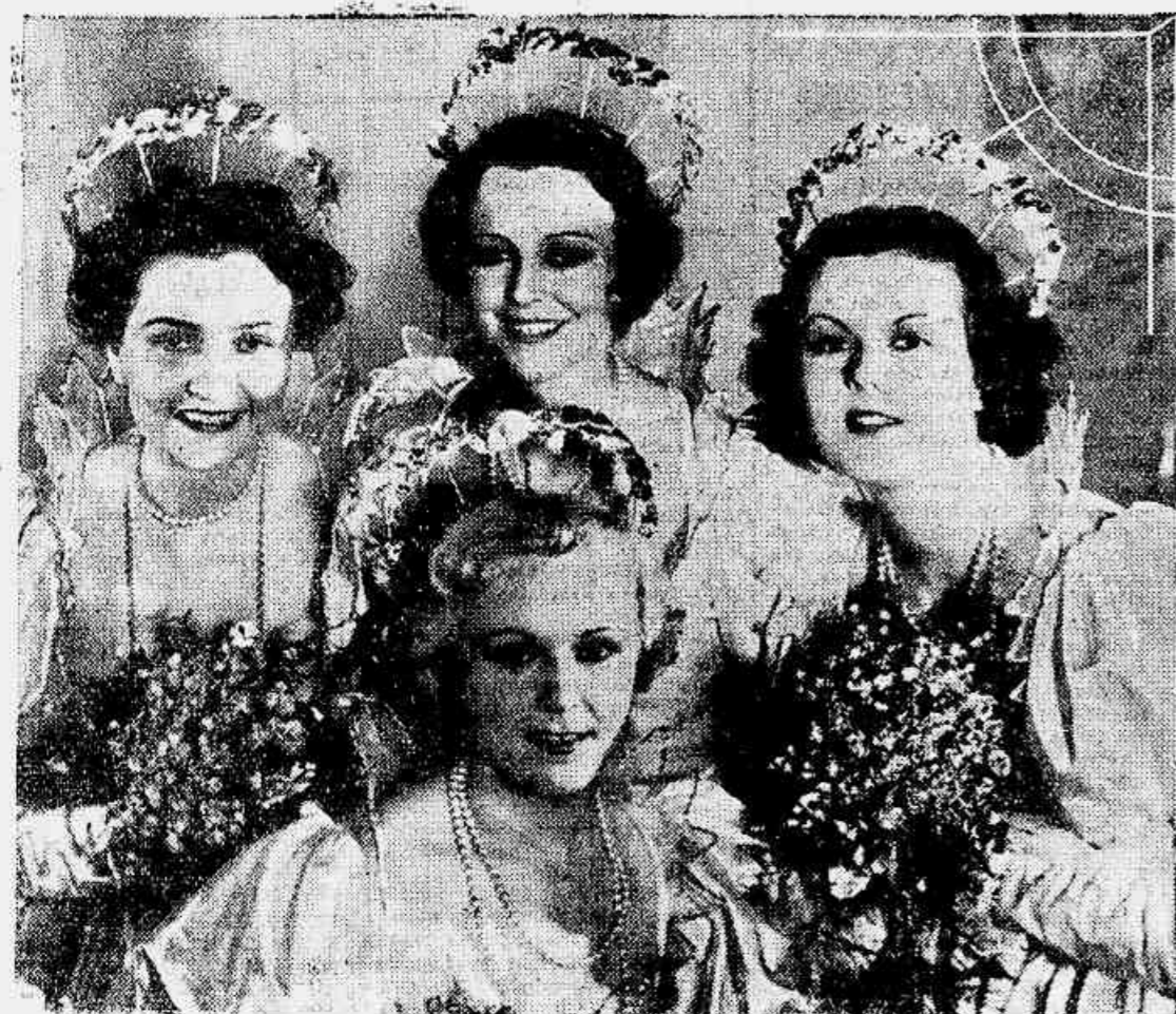
"O Homem" tinha um excelente bom gosto na escolha das pequenas que delle se enamoravam, attrahidas pelas magicas... Mas que "homem"? "O Homem que Fazia Milagres", é claro...

...E os deuses fizeram uma experiencia, dando a um homem vulgar o privilegio de fazer milagres, para vêr se elle salvava a humanidade!