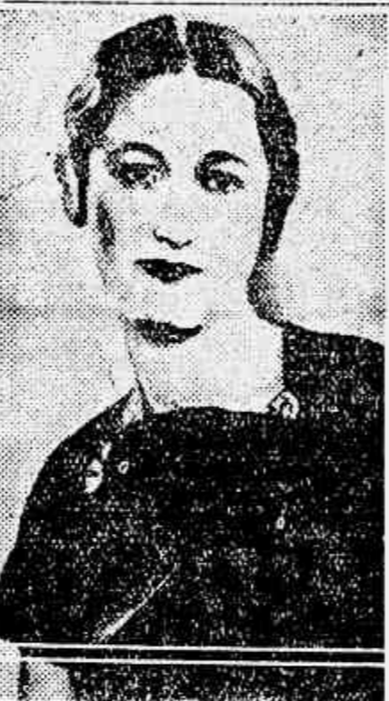
O ex-rei Eduardo VIII e a sra. Simpson

minha irrevogavel determinação de renunciar ao terminação, muito peccado, mas uma demora ulterior só poderia ser muito prejudicial ao povo, que eu procurei servir como príncipe de Galles e como rei e cuja felicidade e prosperidade futuras foi constantemente o desejo de meu coração.