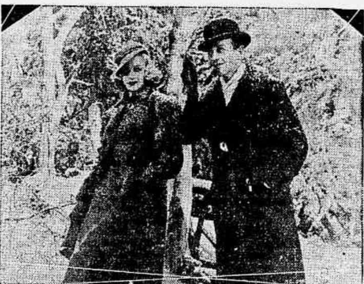
Fred e Ginger, em "Rythmo Louco"

"RYTHMO LOUCO", O NOVO FILM DE FRED E GINGER, DIA 21, NO PALACIO