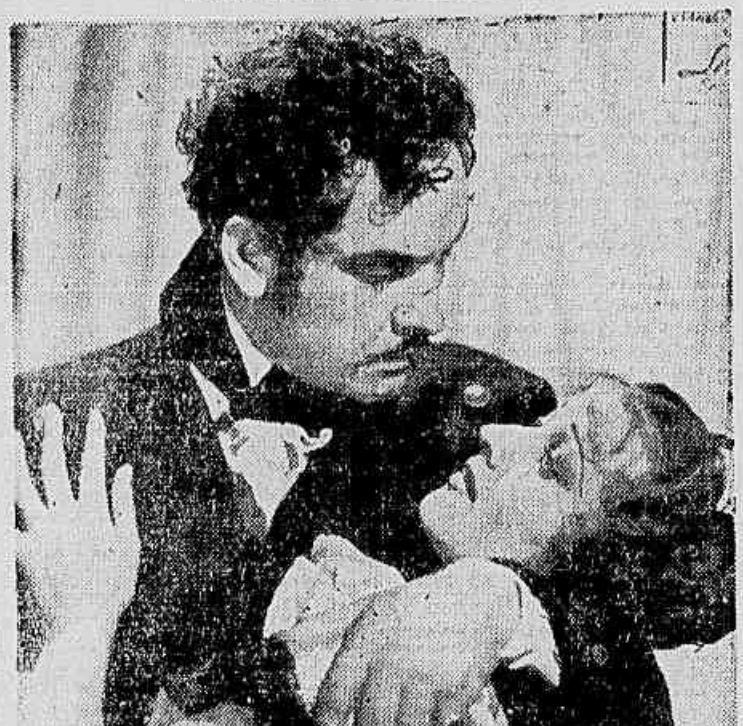
Uma cena do filme

O CAPITOLIO APRESENTA, HOJE, "LAFITTE O CORSARIO"