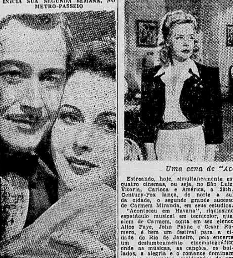
Robert Young e Hedy Lamarr, em "Sol de outono"

"Sol de outono" INICIA SUA SEGUNDA SEMANA, NO METRO-PASSEIO