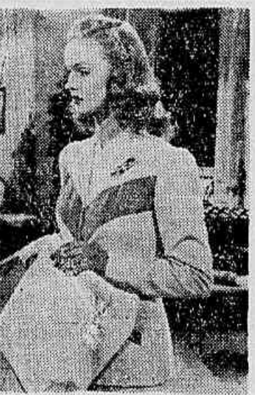
Uma cena de "Aconteceu em Havana"

"ACONTECEU EM HAVANA" ESTRÉIA, HOJE, NO S. LUIZ, VITORIA, CARIOCA E AMERICA