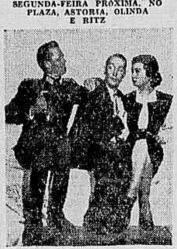
As três figuras principais do filme

"Um louco entre loucos" SEGUNDA-FEIRA PRÓXIMA, NO PLAZA, ASTORIA, OLINDA E RITZ