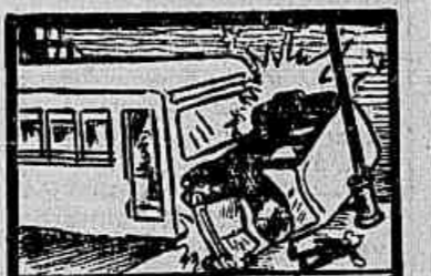
VITIMAS DO TRAFEGO (MORTOS NESTE MÊS)

Não custa mais do que os dentífricos comuns