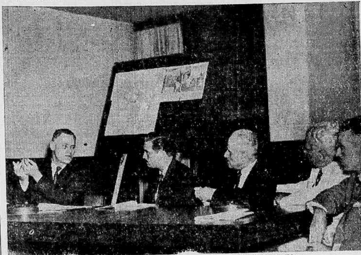
Flagrante fixado no momento em que falava o general Juarez Távora

Discussão, em mesa redonda presidida pelo gal. Juarez Távora, do importante assunto — Como falaram os diversos oradores à assistência que encheu completamente o recinto onde se realizou o ato