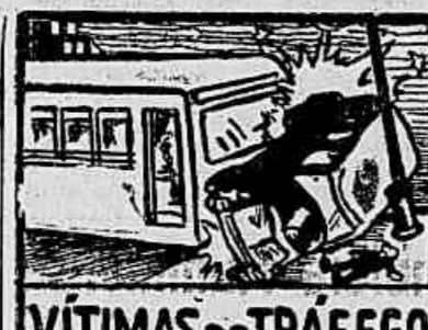
VÍTIMAS DO TRÁFEGO (MORTOS NESTE MÊS)