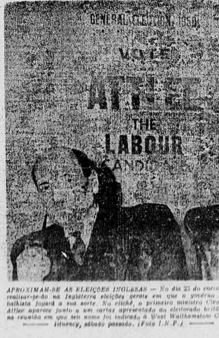
APROXIMAR-SE AS ELEIÇÕES INGLESA - No dia 23 do corrente, realizar-se-ão na Inglaterra eleições gerais em que o partido trabalhista jogará a sua sorte. No clichê, o primeiro ministro Clement Attlee aparece junto a um cartaz apresentado ao eleitorado britânico em reunião em que seu nome foi indicado a West Walthamstow (Guinness Agency, sábado passado).