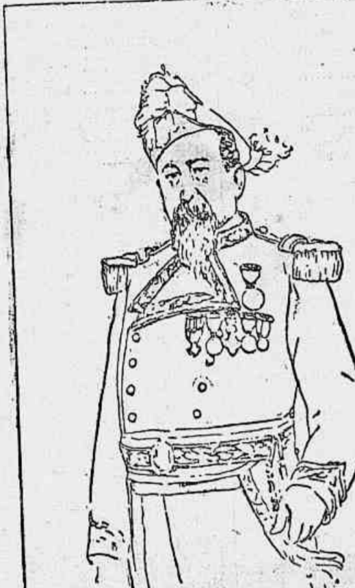
General F. Flores