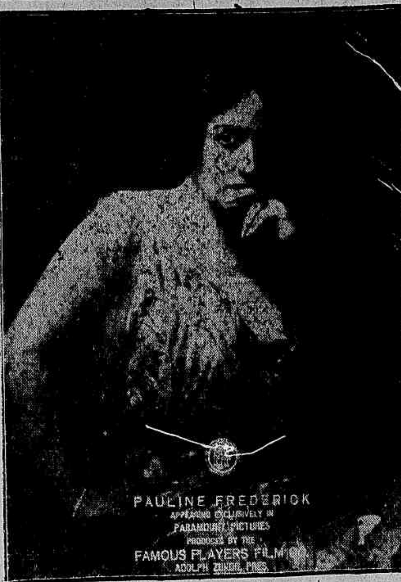
PAULINE FREDERICK APPEARING EXCLUSIVELY IN PARAMOUNT PICTURES PRODUCED BY THE FAMOUS PLAYERS FILM ADOLPH ZUKOR, PRES.

Geraldine Farrar a gloriosissima diva, em uma produção assom- brada da ARTCRAFT, brevemente.