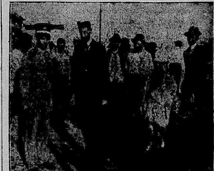
Um representante do Commissariado exercendo fiscalização no Mercado. Uma multidão de curiosos admirando o unico cesto de peixes.

Uma visita ao Mercado Novo, pela manhã — O preço dos ovos — A hortaliça e o peixe — A acção do Commissariado