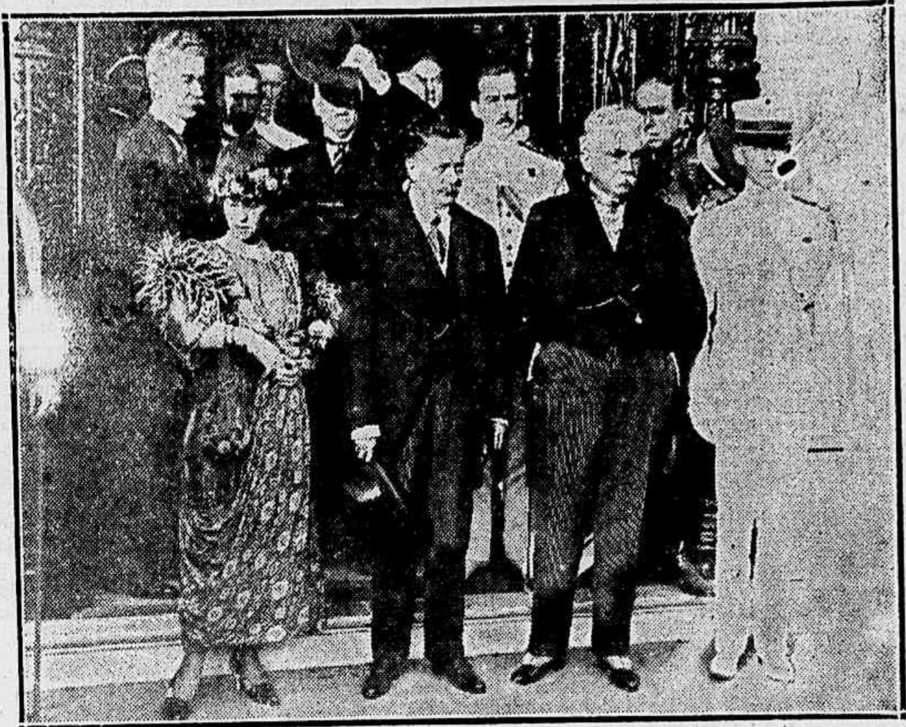
O Sr. Epitacio Pessoa ao sair do Cattete, em companhia de sua familia

O Sr. Epitacio Pessoa, que vem de representar-nos de uma maneira brilhante nos paizes europeus e na America do Norte, teve honras verdadeiramente consagradas, da parte do povo brasileiro, representado por todas as classes sociais. Foi no império no estrangeiro pelo seu intellecto privilegiado, pela sua cultura, pelas suas qualidades moraes, que o nome de S. Ex. surgiu das combinações para a escolha do candidato a presidencia da Republica. Uma vez lembrado, como quem, substituindo Ruy Barbosa na embaixada da Paz, era, do mesmo modo, o unico brasileiro capaz de concorrer nas urnas com tal candidato escolhido pelo povo, antes de se manifestarem as greys politicas — não tiveram outro recurso os politiqueros senão o de acceptar-o como o futuro dirigente da nossa patria. E assim, em vez de travar-se a luta da intelligencia com a multidão — tivemos um pleito de que haveria de sair victorioso, fosse como fosse, um homem cujo espirito paira muito acima do nivel moral e intellectual dos chefes e dos cabos electoraes. Venceu Ruy, venceu Epitacio — era sempre a victoria da intelligencia. Chegado de tal modo a cadeira presidencial, teve S. Ex. na Patria a glorificação correspondente ás de que foi alvo nos paizes mais civilizados do velho e do novo mundo.