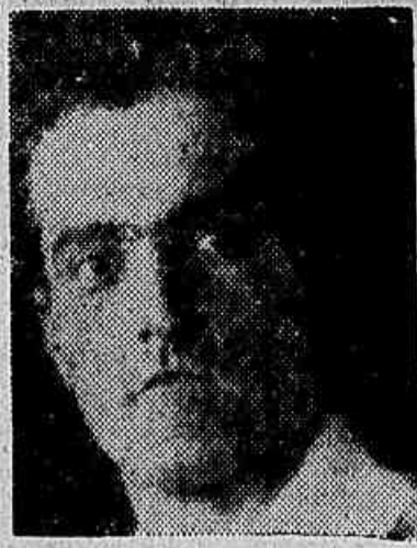
O colossal Kunz