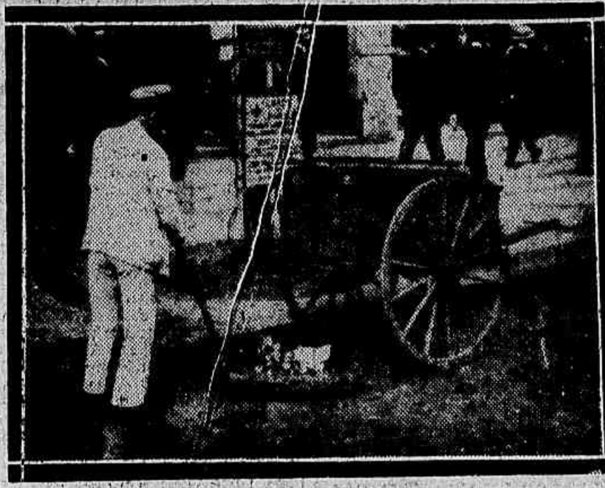
A limpeza da Avenida Rio Branco dos capatazes, dos fletores e fiscaes.

Nas noites frescas, da tempo limpo e secco o trabalho é sempre mais supportavel; nas invernosas, porém com o frio cortante, e em que a limpeza quasi se limita á lavagem das vias publicas -- é de compungir ao coração mais insensível. Porque não só é o peso das carroças, arrastadas ao longo das ruas, kilometros e kilometros; não é só a exigencia dos que fiscalizam o trabalho; é, sobretudo, o desconforto em que executam o serviço -- a roupa encharcada os pés mettidos na água,