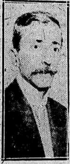
Deputado Salles Filho

Art. 6º -- Revogam-se as disposições em contrario.