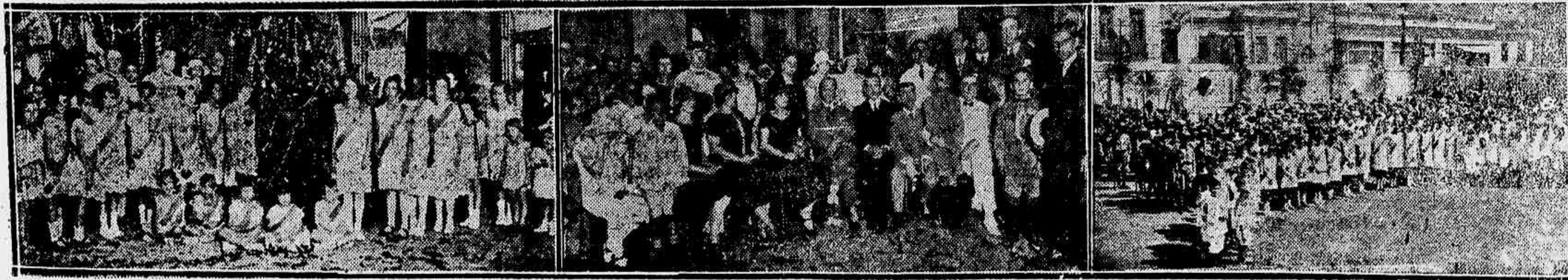
Tres aspectos da brilhante festa realizada domingo, no Instituto Ferreira Vianna, e promovida pelo Rotary Club

Revestiu-se de muito encanto a festa que o Rotary Club offereceu domingo, á tarde nos salões nobres das nobres escolas municipaes. Attractivos os mais interessantes constavam do programma organizado, permitindo desde modo á petizada pobre, cuja norte não lhe produziram um natal nos fantasmas do futuro e não estar, algumas vezes da consoladora alegria.