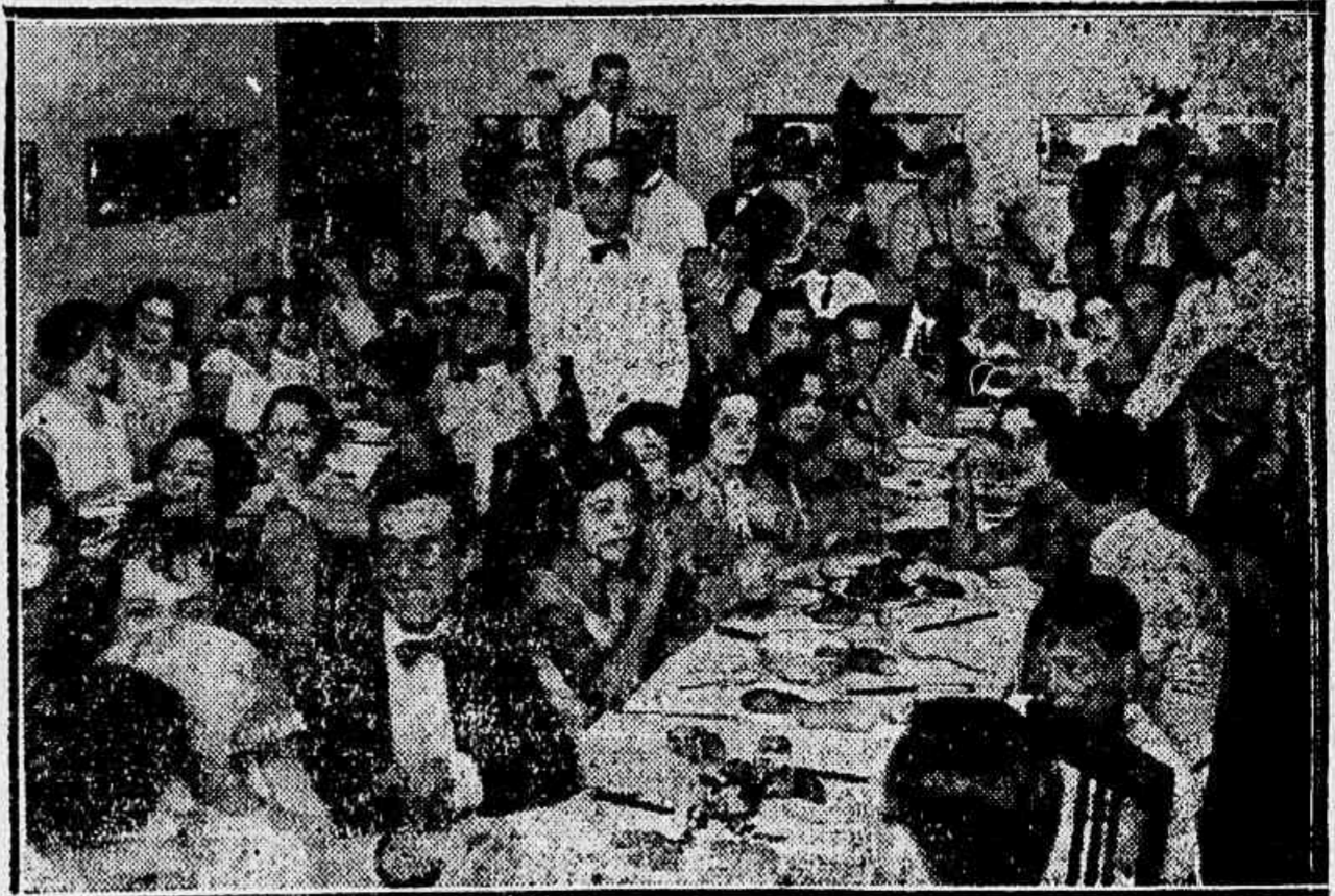
Na "Caverna", o pessoal atitulado para entrar na peixada, prepara pelos "Anjinhos"

Mimosas Cravina, Chaveiro de Prata, Kananga do Japão, Recreio das Flores, Recreio de Santa Lucia, Papoula do Japão, Ramos Club, Mandiabrados de Ramos, Recreio da Juventude, Sabinas do Meyer, Fenianos de Cascadura, Flor Tapuya, Democraticos de Madureira, Filhos de Talna, Flor do Abacate, Corbetta de Flores, Congresso dos Democraticos, Bloco dos Tetas, Elles te