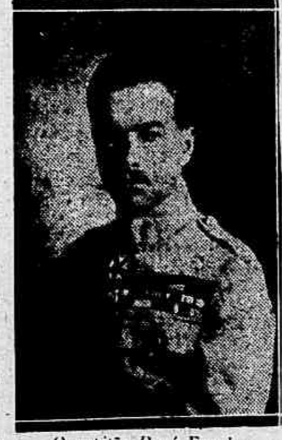
O capitão René Fonck

E elle descreve o seu avião — um avião que carrega 4.000 litros de essencia, de uma complexidade