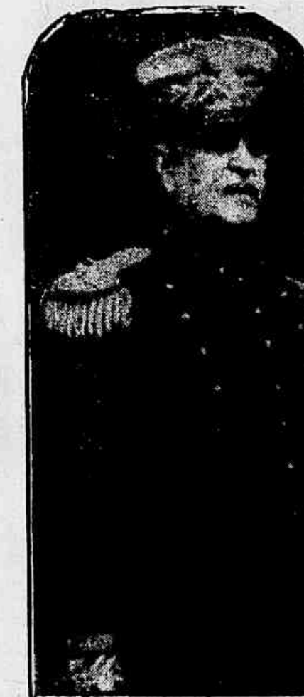
General Tasso Fragoso

O arbiro general Quirin, da Missão Francea, hontem iniciou o seu serviço de inspecção.