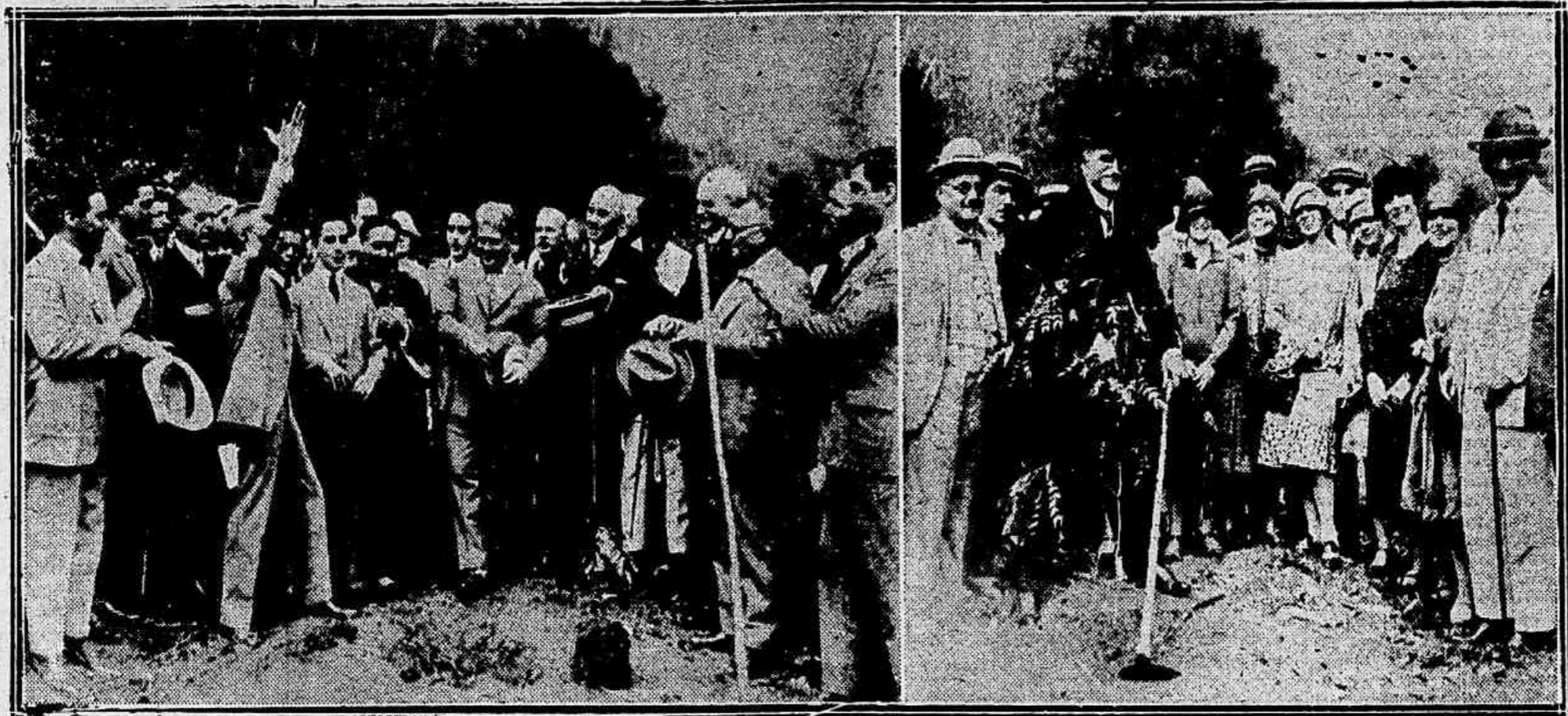
Aspectos da cerimonia da plantação da arvore: flagrante do escriptor Coelho Netto, no momento em que pronunciava vibrante discurso; o Sr. ministro da Agricultura pia-

Com enorme assistencia, em que se viam representantes das altas autoridades do pais, e a presença do Sr. ministro Miguel Calmon, deputados, senadores e grande nu- mero de funcionarios, realizou-se a festa da Arvore no Horto Flo- restal. Foi uma cerimonia que teve a assistencia de um avultado nu- mero de crianças, que presenciou hontem uma solemnidade simples e tocante, e que a alegria da pei-