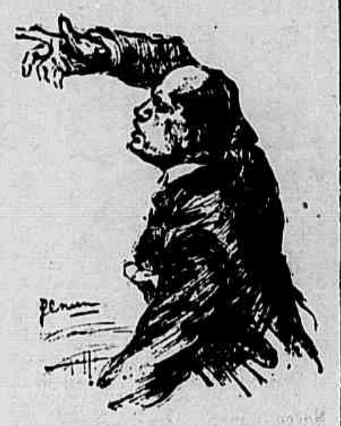
Mussolini risponde a Schepel (Cronisti del "Giornale d'Italia").

"Quel contatto — scrive Verax — fu ruvidissimo; ma la ruvidezza fu tutta per la Camera, non per il Duce, e il loro incontro fu tanto più