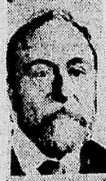
Senador Paulo de Frontin

Com um ramal para Quarahy o saladeiro dessa cidade que dá por saíra cem mil pesos á estrada de ferro de Artigas-Uruguayua, procurará enviar os seus productos pelos nossos portos.