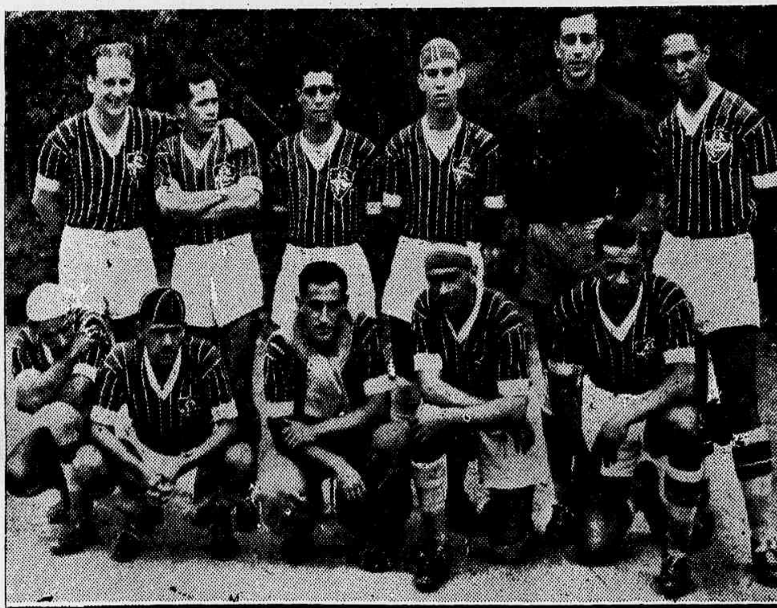
O valoroso esquadão do tricolor que trá pôr em xeque o conjunto argentino

Os amantes do "Association", terão oportunidade de assistir domingo proximo a um choque que de verá arrastar ao stadium de Alvaro Chaves, uma assistencia numerosa.