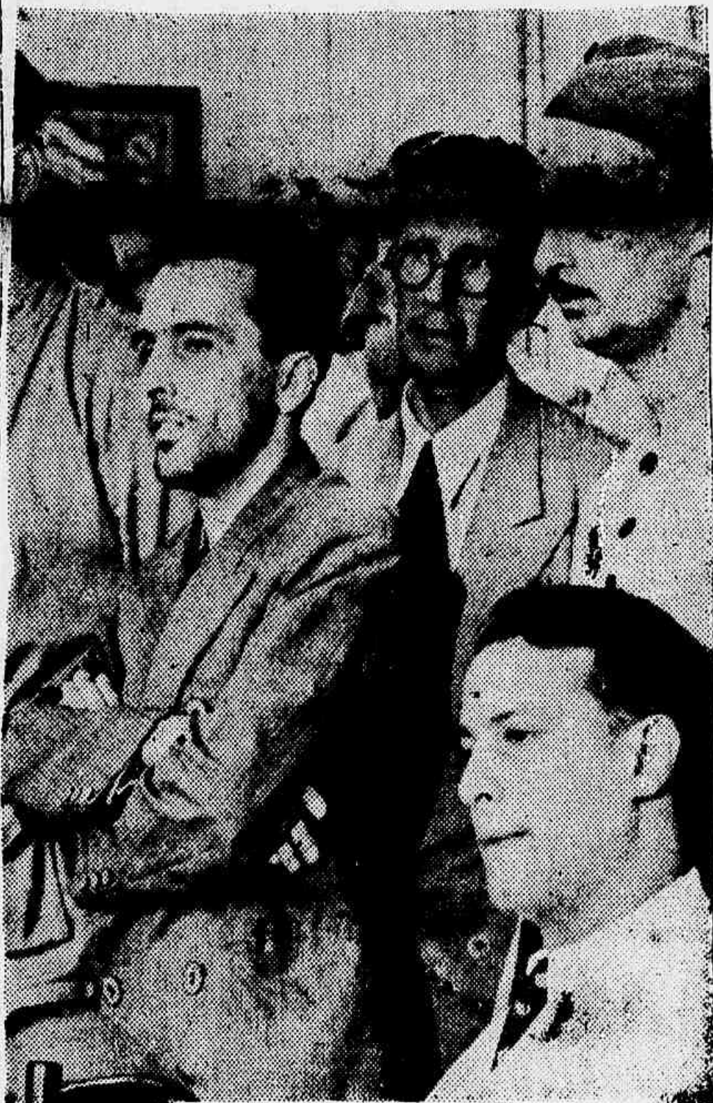
Luiz Carlos Prestes, deante do juiz summariante

WASHINGTON, 8 (U. P.) — Urgente — A's 11 horas da manhã de hoje ficaram suspensas as conversações entre os membros da missão economica brasileira e as autoridades do Departamento do Thesouro dos Estados Unidos. Sabendo da conferencia o ministro Souza Costa declarou á imprensa que "a criação de um Banco Central no Brasil constituiria o principal assumpto tratado nas conversações".