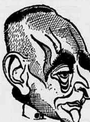
Estilac Ministro da Guerra de Vargas, cúmplice dos que tramam o massacre de nossa juventude

Nosso povo odeia a guerra e se recusa a servir de carne para canhão na defesa dos seus interesses dos banqueiros americanos. E quem não estiver contra o envio de tropas seja para a Coreia, seja para onde for, está contra o povo. Não importa que o palavreado seja demagógico: os fatos desmascaram os tapeadores. Leia na 3.ª página nosso Editorial sob o título «Remessa de tropas e demagogia».