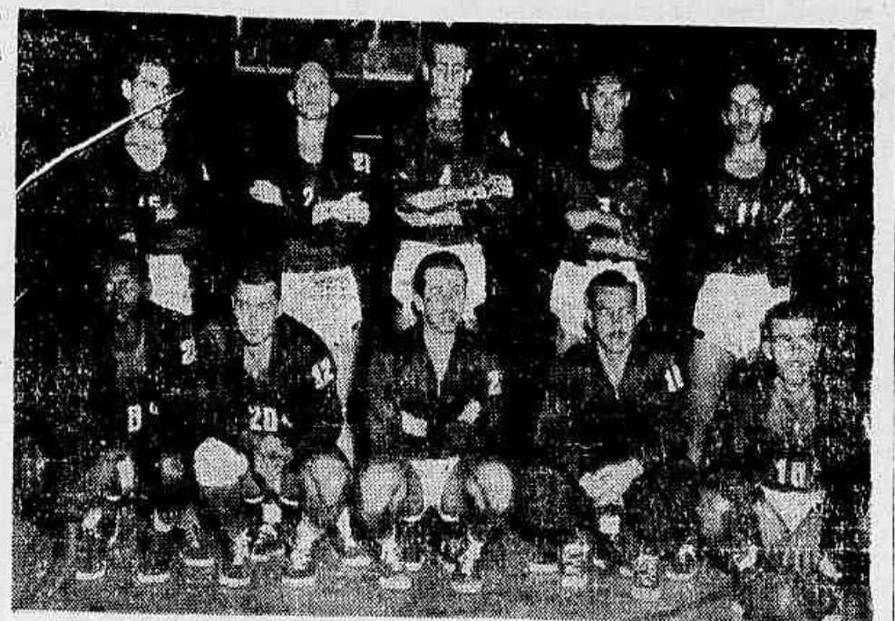
O elenco rubro-negro, cuja estréia dar-se-á em Bruxelas. Terá como adversário o "Gand".

O aviso que os conduzirão, deixará o aeroporto do Galeão rumo a Paris, via Recife, Dakar e Lisboa, às 17 horas do dia 1.º. Deapartir francês, após breve repouso, continuará os atletas brasileiros para Bruxelas, onde deverão estreiar contra o Gand.