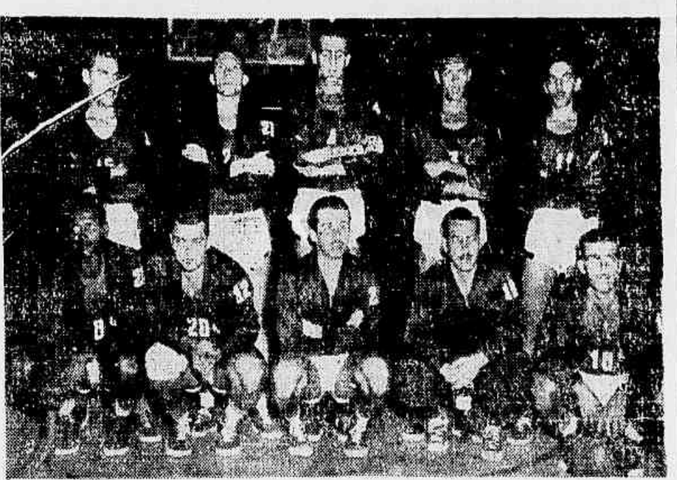
O elenco rubro-negro, cuja estréia dar-se-á em Bruxelas. Terá como adversário o Gand.

Embarcam no dia 19, às 17 horas — Rumo a Paris, via Recife, Dakar Lisboa — Em Bruxelas, a primeira apresentação