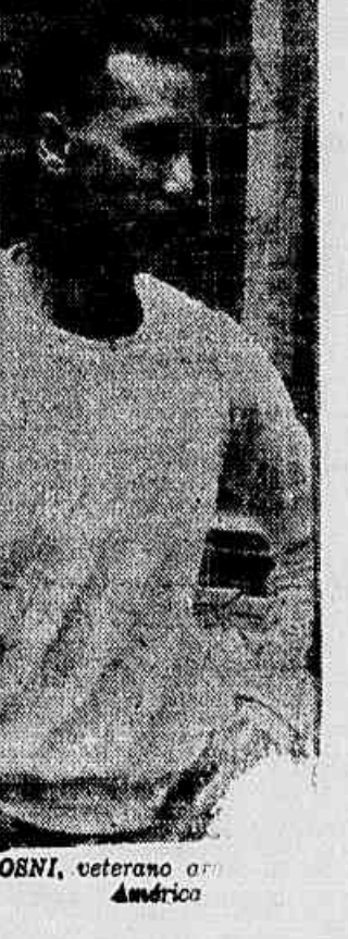
OSMI, veterano do América