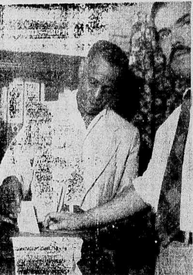
FLAGRANTE FEITO ONTEM, DURANTE AS ELEIÇÕES no Sindicato dos Trabalhadores em Construção Civil, quando votava um associado. A Chapa Unidade que disputa o pleito é a favorita dos operários. Até ontem, as urnas tinham recebido perto de 600 votos, tudo indicando que o «quorum» de 833 sufrágios será coberto hoje

A COMISSÃO de Racionamento voltou a se reunir, ontem, pela manhã, a fim de estudar o pedido de racionamento de energia elétrica feito pela Light, para o corrente ano. O que deliberou aquela Comissão não foi dado a público, mas o resultado será encaminhado ao Conselho de Água e Energia Elétrica que, na próxima semana decidirá sobre sua aprovação. CERTO O RACIONAMENTO O pedido da Light baseia-se, como sempre, na esdrapada desculpa de escassez de chuvas e que, em consequência da estiagem, vai baixando «assustadoramente» a vazão do Rio Paraíba. É esperada, portanto, como das vezes anteriores a aprovação da medida pelo CNAEE, devendo entrar em vigor o racionamento antes do período estabelecido pelo próprio Conselho em sua última reunião de 1953, que estava marcado para fins de junho de 1954.