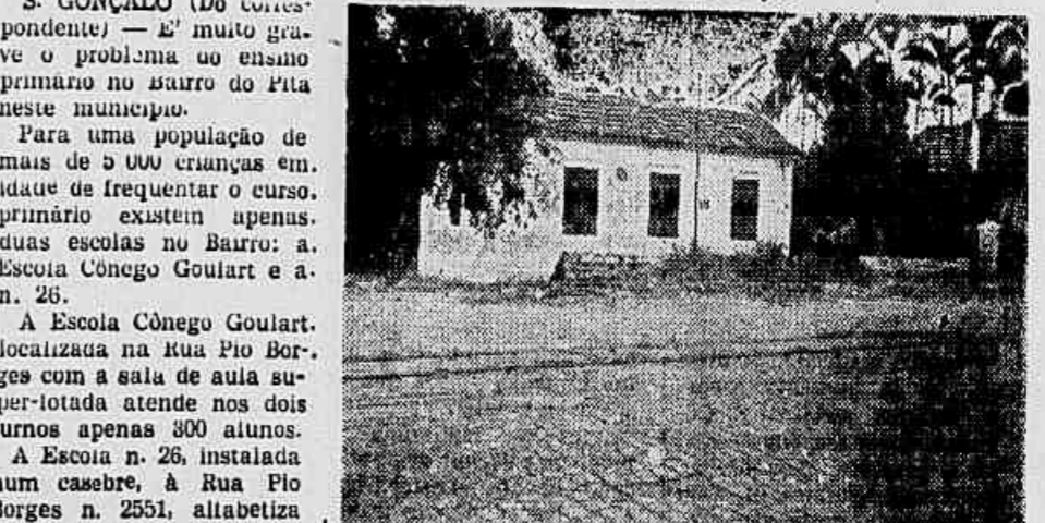
Nesta casa funciona, em situação precária, a Escola n.º 26, do Bairro do Pita

As duas únicas existentes funcionam superlotadas — Esgotam-se as matrículas no primeiro dia de inscrição