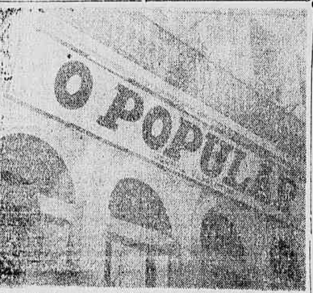
Reunião até em seu leito, no qual diz ser vespertino, o matutino "O Popular" não paga os salários de seus graficos e redatores e chama-os de "vermelhos" porque não desejou passar fome

— Por motivos dessa espécie, disseram-nos os trabalhadores, temos com certa vitória da Chapa Unidade, que defende os nossos interesses.