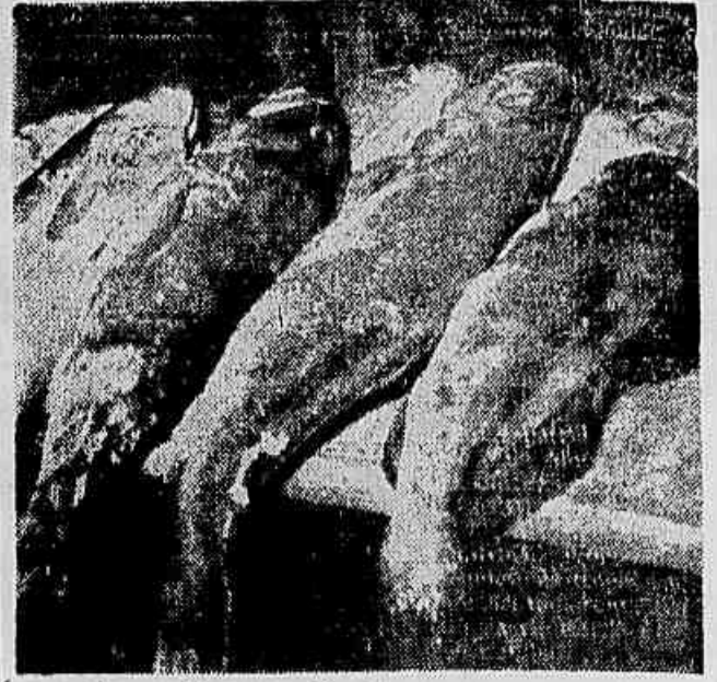
O carioca está ameaçado de passar a semana santa sem peixe

economia, foram congeladas as verbas da Secretaria de Saúde.