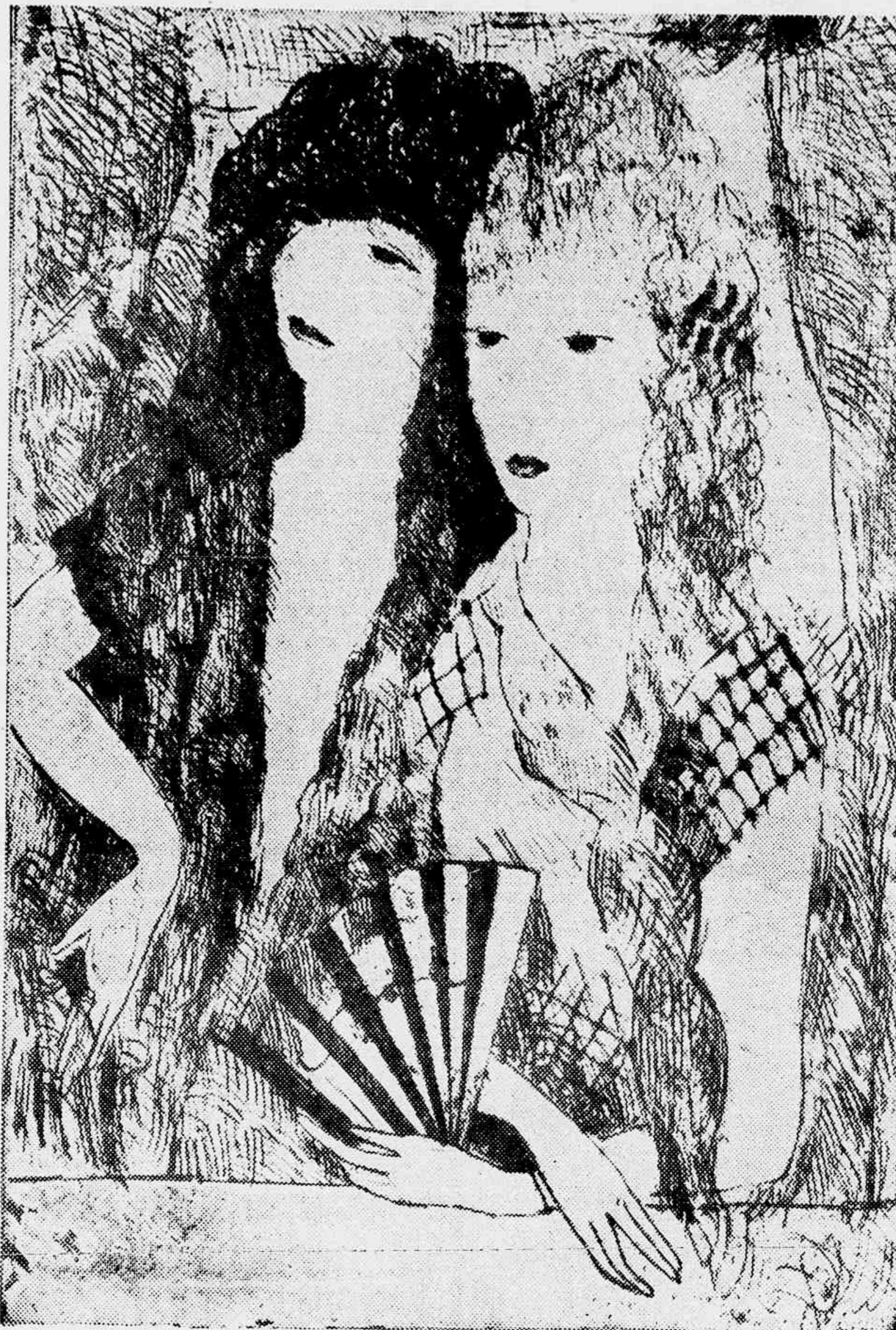
"Mulheres espanholas" — MARIE LAURENCIN