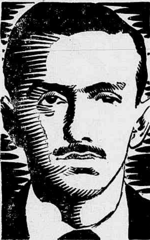
João Cabral de Melo Neto