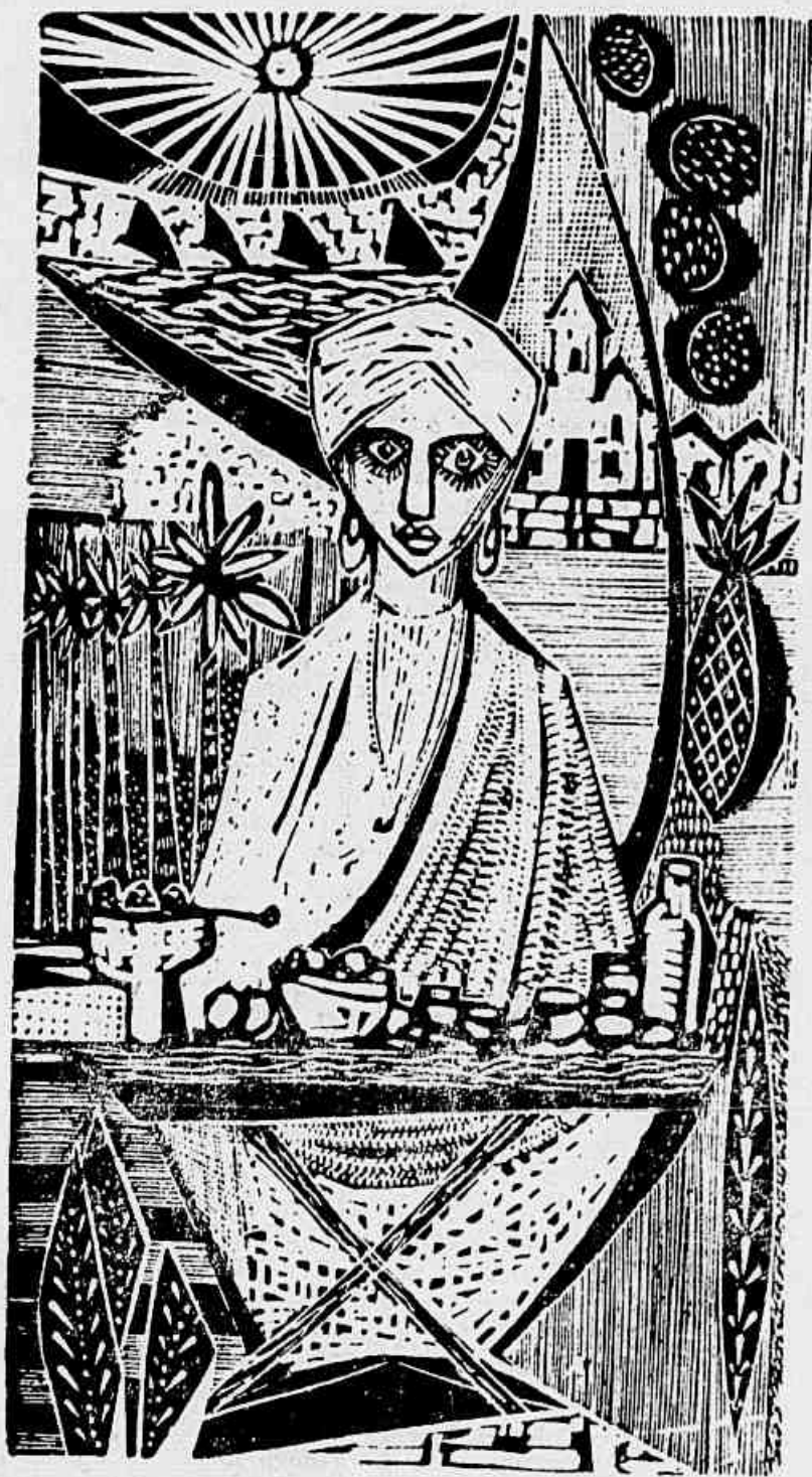
Linogravura de YLLEN KERR

O professor Emile Langul, encarregado pelo Governo Belga de superintender à formação da representação daquele país, informou à Bienal que atingirão provavelmente a 90 o número de