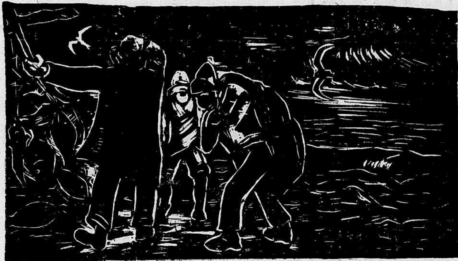
Xilogravura de OSWALDO GOELDI

Durante a guerra de 1914, prestando assistência social aos refugiados das regiões invadidas na França, Edith Wharton consignou suas impressões do heroísmo em livros como "La Marne" e "Fighting France". Numerosas novelas reunidas em volume, uma autobiografia "A Backward Glance", e um ensaio sobre a estética do romance completam essa obra rica, de uma técnica acabada, marcada pelos mais belos êxtos. Edith Wharton é realista pela segurança da observação, pela exatidão da pintura de costumes, pela escolha e o conjunto dos traços dos caracteres. Mas sua imaginação, sempre ativa, retoca os dados da realidade; sua inteligência pronta a interpretar tanto quanto a compreender, recompõe a vida. Ela agrupa, ordena, associa ou opõe os dados da experiência; vivifica pela intuição e realça pelo estilo para obter os quadros mais justos, as figuras mais salientes, isto é, para realizar, como procurava Balzac, "a verdade pela arte".