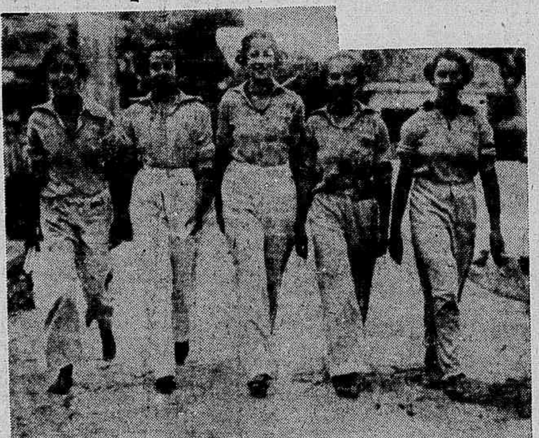
Cinco "nações", que vão tomar parte na competição de domingo

10.º pareo — Principiantes — 100 metros, nado livre — Lau-