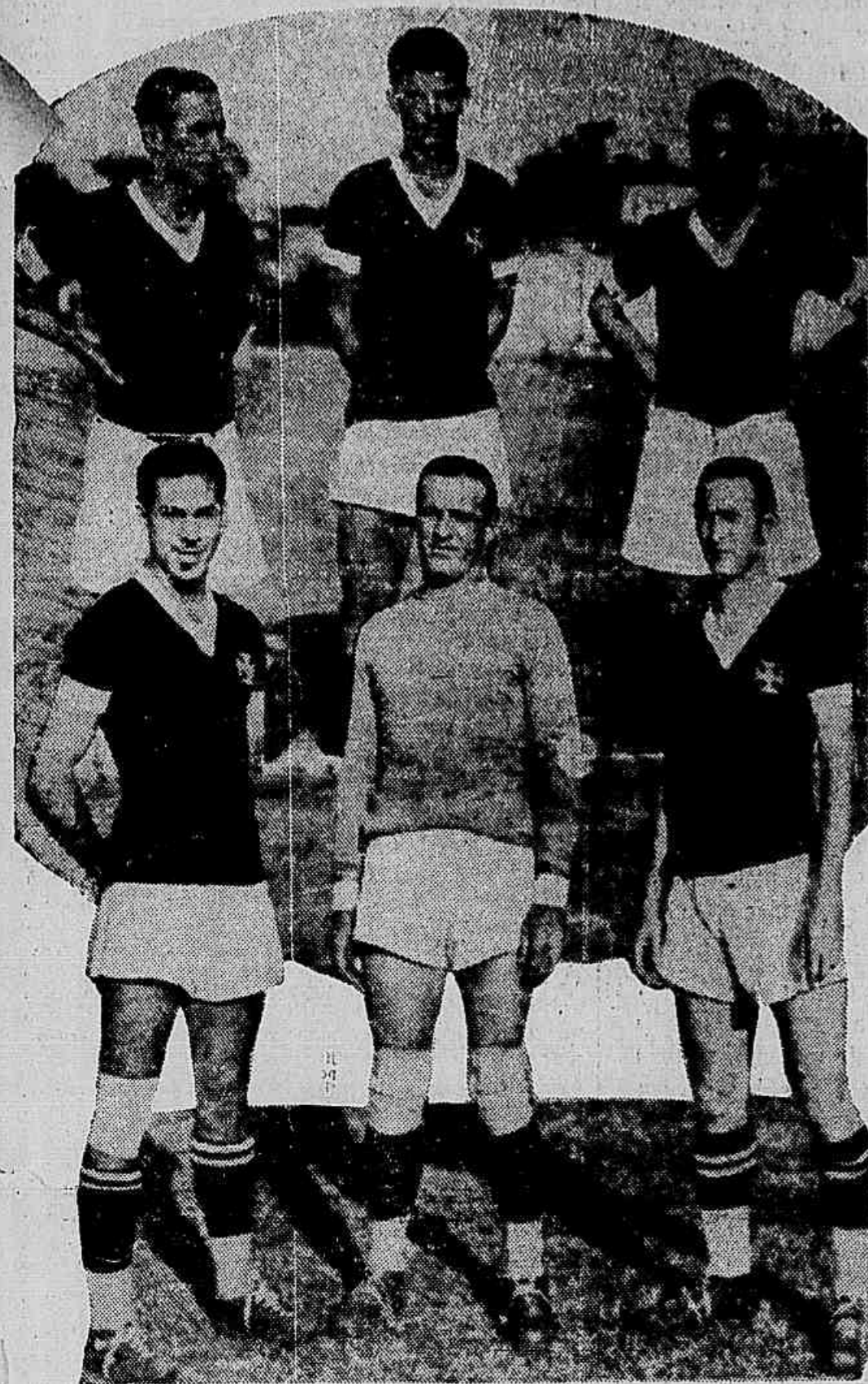
Elementos do Vasco, que tomaram parte no sensacional cotejo com o Botafogo

O sensacional choque entre o C. R. Vasco da Gama e o Botafogo