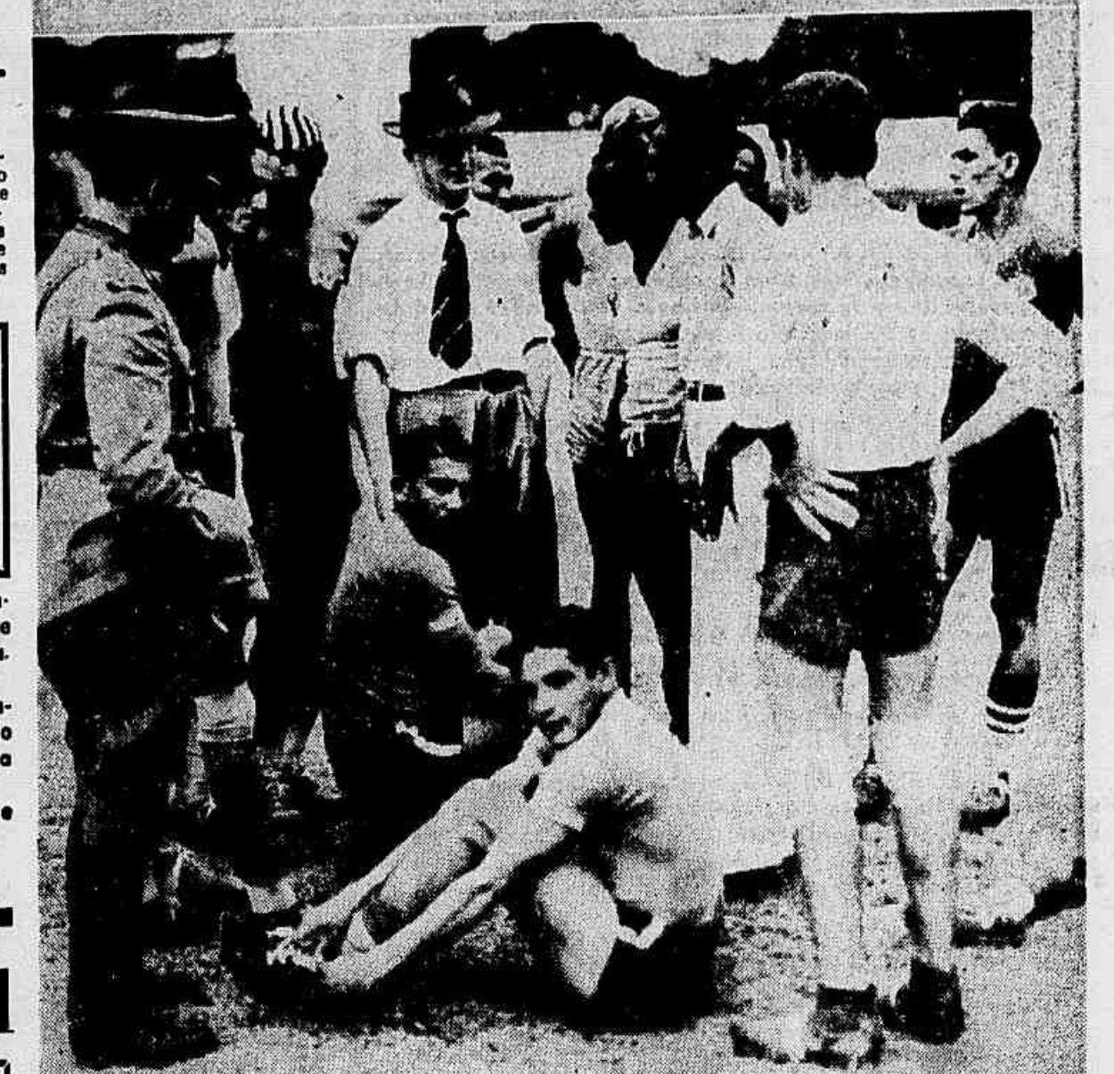
Flagrantes tomados por ocasião do treino de ontem. Em cima, o selecionado cearense. Em baixo, um aspecto durante o descanso.

Apesar da chuva ou, talvez, por isso mesmo... os cearenses realizaram com grande animação o seu anunciado treino, na tarde de ontem. Ao que parece, entretanto, não foi seu intuito marcar tentos, a não ser nos últimos 20 minutos em que, numa excelente demonstração de fôlego exerceram grande reação, conseguindo dois pontos, enquanto o quadro de amadores do Botafogo, seu adversário, só conseguiu vasar uma vez as suas redes.