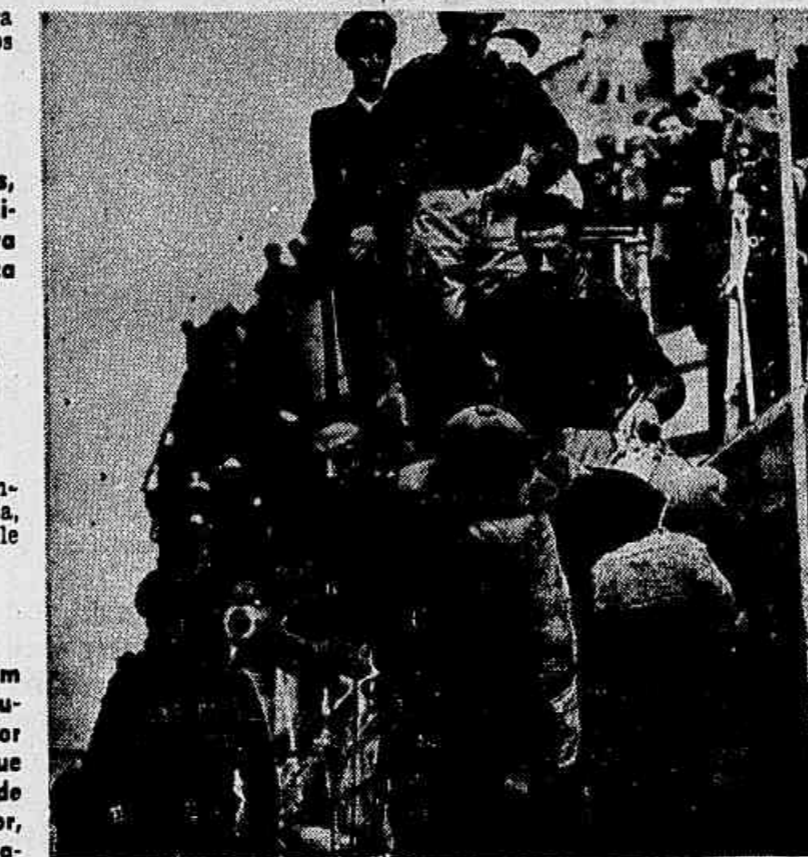
Mais um aspecto do desembarque dos piratas da cruz suástica