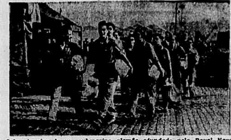
Sobreviventes de um submarino alemão afundado pela Royal Navy chegam a um campo de concentração da Grã Bretanha

O submarino tem sido uma das armas mais intensamente utilizadas por Hitler. No início da guerra os traiçoeiros barcos chegaram mesmo a constituir uma das grandes esperanças dos nazistas, que viam na sua campanha a realidade de vencer o heróico povo inglês, submetendo-o à fome. Em torno do Grã Bretanha estabeleceu-se uma rede de embarcações invisíveis, e cada navio que se aproximava dos portos ingleses estava sob o raio de ação dos torpedos nazistas. Mas não tardou que Hitler visse os seus planos frustrados. No ar surgiu um abrir e fechar de olhos uma poderosa RAF e no mar, enxames de caça-submarinos, cruzadores e destróieres perseguiram sem tréguas os piratas da cruz gamada. Impactos diretos passaram a chover incessantemente sobre os submersíveis inimigos. Neste conjunto de gravuras, vemos expressivos flagrantes das derrotas dos piratas nazistas.