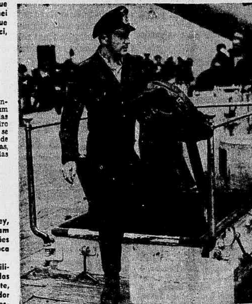
Depois de uma vinda sinistra através dos mares, este oficial alemão teve o seu submarino afundado. Conseguindo escapar à morte, foi entretanto recolhido pelos ingleses. Vêmo-lo aqui, deixando o tombadilho inferior, rumo a um campo de concentração