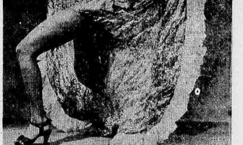
LUAR EM HAVANA E VINGANÇA SANGRENTA - O Cinema PARISIENSE exibirá, na próxima segunda-feira, dois filmes da Universal, sendo que o primeiro "Luar em Havana" tem no "cast" Allan Jones e Jane Frazee. É uma comédia musical de grande sensação. "Vingança Sangrenta" é um "far-west" com Johnny Mack Brown, Na gravura, um instante de "Luar em Havana".